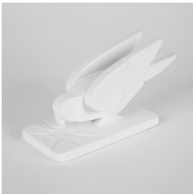
Рисунок 5 - «Синяя птица», керамика, выполнено при помощи программного обеспечения для 3D-моделирования SketchUp, Дмитрий Аске, 2020 г.