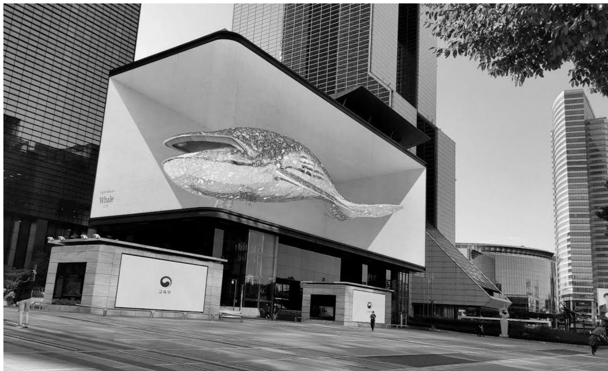
Рисунок 3 - Паблик-медиаарт, анаморфное 3D-видео «Кит» на экране студии дизайна «d'strict», ТЦ «SMTOWN Coex Artium», компания «SM Entertainment», при поддержке «LG», Сеул, 2021 г.

«Art today» – искусство, которое актуально и современно «здесь и сейчас» (см. рис. 3). К актуальному искусству относятся все те арт-практики, которые вызывают наибольший интерес у зрителя в конкретный временной период; актуальное искусство является центральным звеном современного арт-рынка. Например, сегодня популярны выставки трансдисциплинарных художников «уличной волны»: Д. Аске, А. Адно, Б. Трулув и др. (см. рис. 4-6). В процессе создания произведений авторы активно внедряют новейшие цифровые технологии: 3D-моделирование, AR/VR и т. д. Художники интегрируют инструментарий медиаарта и устройств виртуальной реальности (очки, шлем) не только в студийные произведения, но и для сайт-специфичной практики паблик-арта.