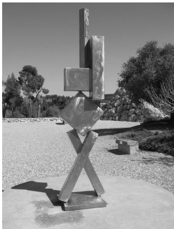
Рисунок 1. Сайт-специфичная скульптура Cubi VI, Д. Смит, 1963 г., Национальный музей Израиля

Проблема частичного слияния терминов «contemporary art» с «postmodern art» возникла на основании работ Р. Краусс и Й. Хайзера. Критик и теоретик искусства Р. Краусс в своей диссертации, посвященной творчеству абстрактного экспрессиониста Д. Смита (см. рис. 1), обозначила скульптуры художника как «contemporary» – современные, т. е. актуальные на тот период времени [Krauss, 1971, 15]. В исследовании «All of a sudden. Things that matter in contemporary art» немецкий журналист и куратор Й. Хайзер рассматривает «современное искусство» начиная с творчества М. Дюшана [Heiser, 2008]. На этом основании в западной теории и истории искусства сложилась практика применения понятия «contemporary art» относительно второй половины XX в. и XXI в. – в контексте экспериментальной эстетики и передового искусства с момента окончания Второй мировой войны до настоящего дня.