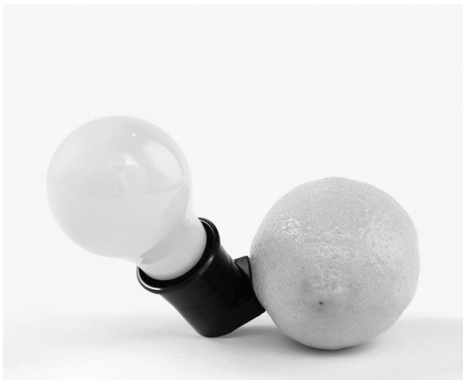
Рисунок 2 - «Батарейка Капри», обже труве, Й. Бойс, 1985 г.