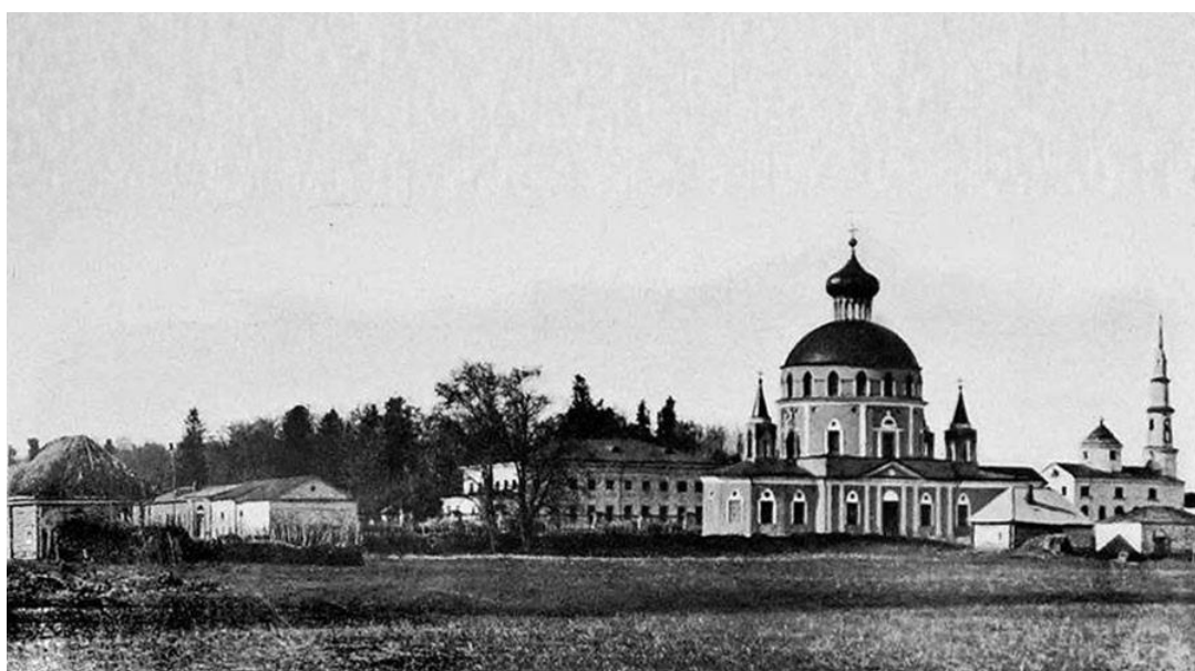
Рисунок 6 - Усадьба Н.Е. Струйского. Село Рузаевка

Типография Струйского была одной из лучших в России того времени. Издававшиеся здесь книги стали библиографической редкостью. Сейчас они хранятся в Российской государственной библиотеке, в Москве.