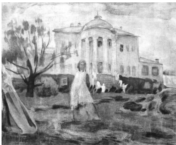
Рисунок 7 - В.Э. Борисов-Мусатов «Призраки» (1903)

Усадьба князей Голицыных была запечатлена на полотнах замечательного живописца В.Э. Борисова-Мусатова (1870-1905): «Гобелен», «Встреча у колонны», «Водоем», «Спокойствие», «Призраки». Художник посещал усадьбу в 1899, 1900-1902 годах. Живописный и композиционный строй произведений воплотил мирозерцание мастера. В картинах Борисова-Мусатова нет различимой границы между сном и действительностью. Его полотна уводили зрителей в навсегда ушедший мир старинных дворянских усадеб, к заросшим водоемам, в тенистые аллеи парков.