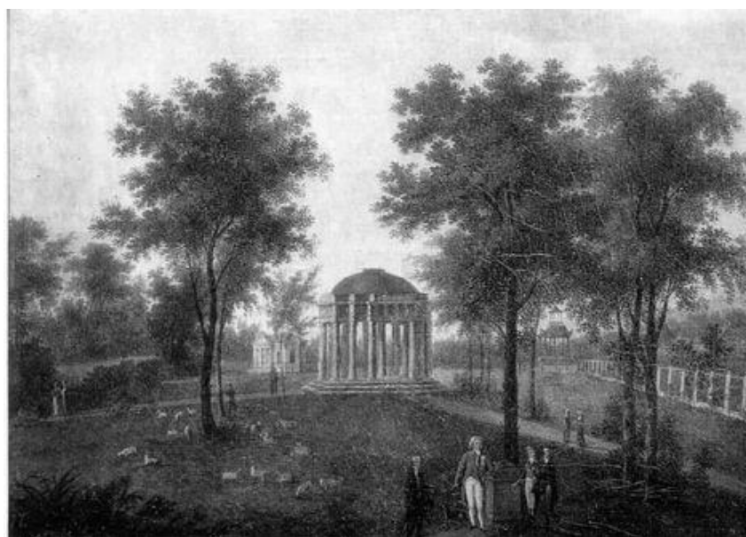
Рисунок 9 - В.П. Причетников. Храм Верности. Вид в парке имения «Надеждино»

В усадьбе Надеждино работал художник В.П. Причетников (1767-1809). На одной из его картин запечатлен храм Верности в парке имения. Являясь центром полотна, он представляется царящим в окружающем пространстве, создавая с ним гармоничную картину.