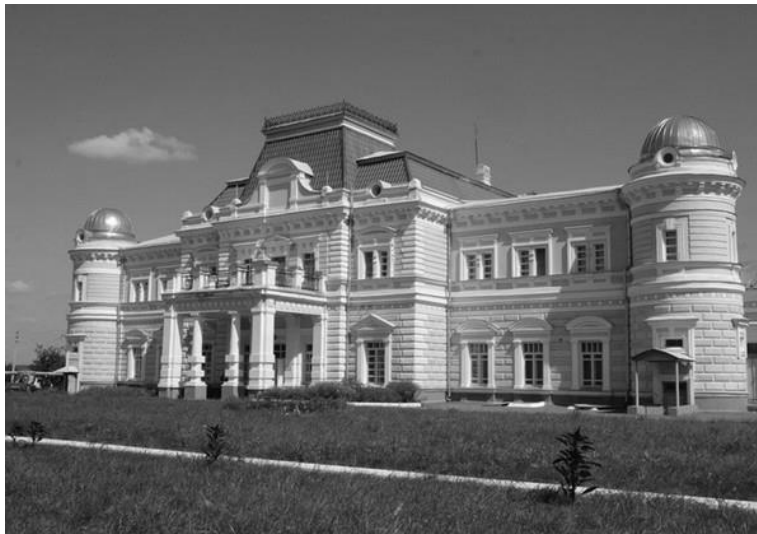
Рисунок 3 - Усадьба князя М.А.Устинова. Грабово