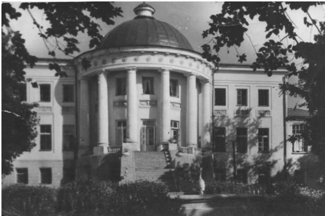
Рисунок 1 - Усадьба Голицыных, с. Зубрилово

построил каменный дворец (проект И.Е. Старова). В 1810-х г. здание было перестроено (предположительно, по проекту Джакомо Кваренги).