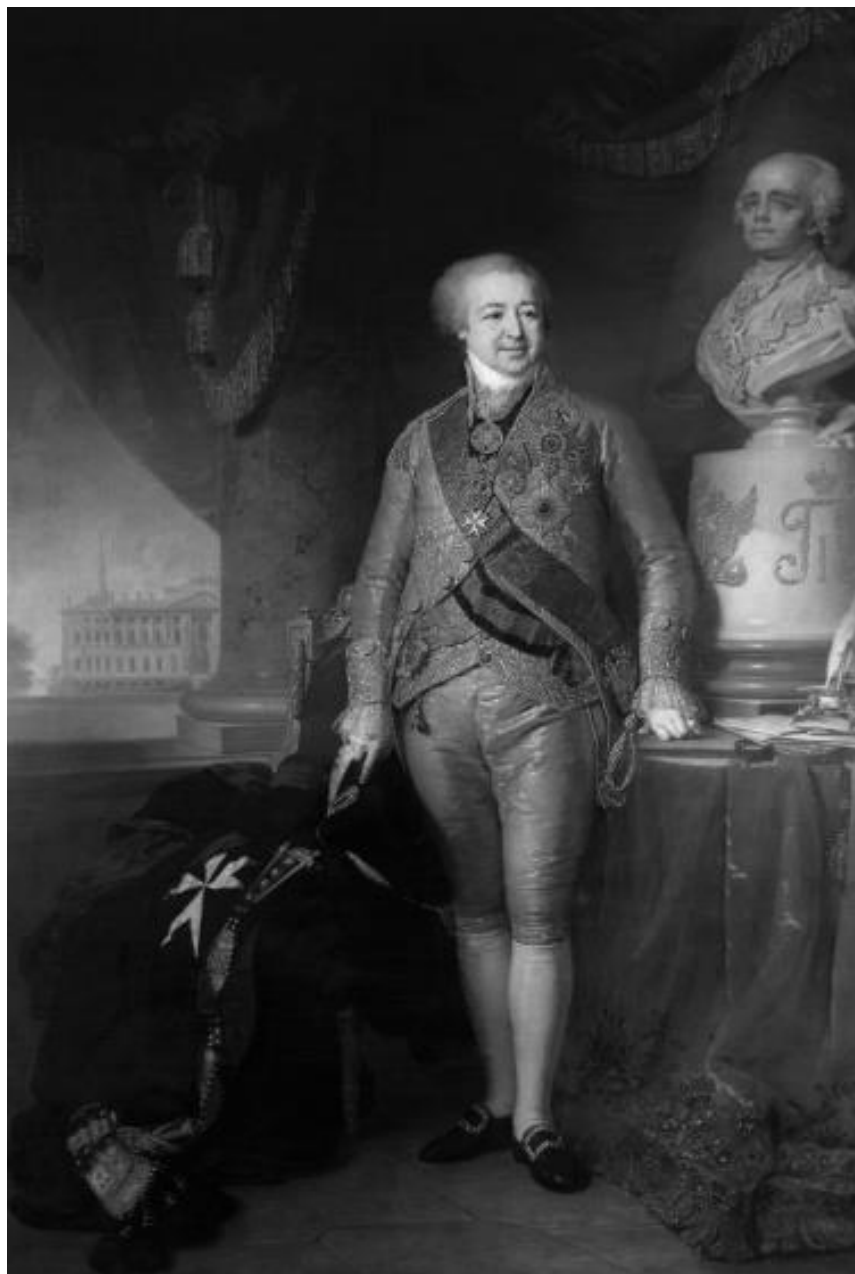
Рисунок 10 - В.Л. Боровиковский. Князь А.Б. Куракин

Автор книги отнес портрет к числу лучших полотен по мастерству исполнения среди произведений Боровиковского. Достижению верной характеристики князя Куракина способствовало использование «лягушачьей композиции». Вид снизу создал чувство «брезгливой пресыщенности» на его «стареющем лице» [Козина, 2020, 66]. По мнению автора воспоминаний, Князь Куракин, прозванный за свое богатство «бриллиантовым», как и мечтал, остался в истории. Он «стал известен потомкам как оригинал прославленного портретиста» [Кузьмин, 2017, 179].