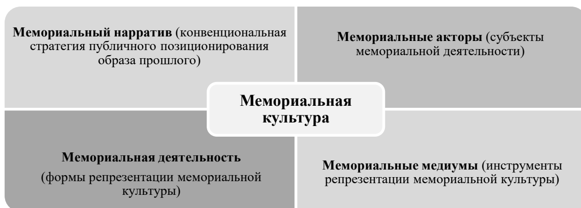
Рисунок 3 - Структура мемориальной культуры (критерий функциональности)

Обозначим сущность каждого из указанных на рисунке 3 компонентов мемориальной культуры.