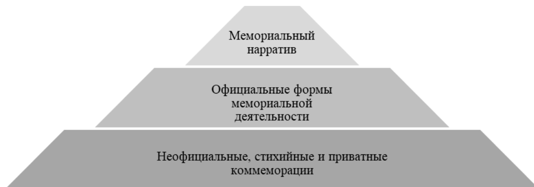
Рисунок 2 - Структура мемориальной культуры (критерий регламентированности)

мемориальной деятельности (бытовые и спонтанные коммеморации, «независимое» художественное производство, мемориальные программы частных музеев и пр.) могут занимать по отношению к официальной политике памяти преобладающую, альтернативную или конфронтационную позиции.