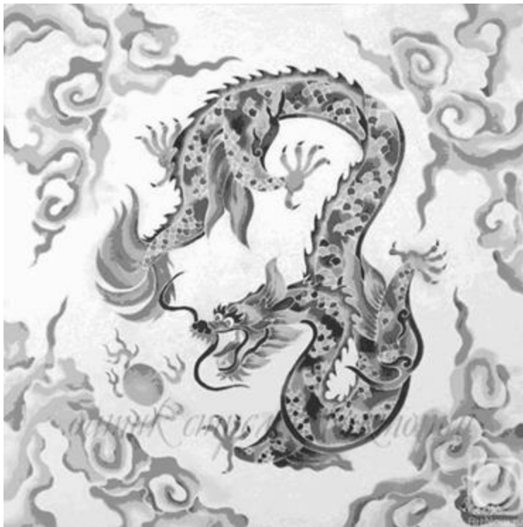
Рисунок 1- Орнамент дракона

В зимние месяцы, по китайским народным поверьям, драконы обитают в подземельях, но во втором лунном месяце они взмывают в небеса, вызывая первые грозы и дожди.