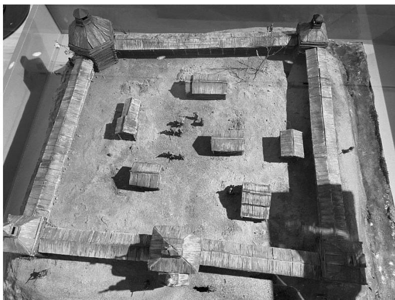
Рисунок 1 - Макет острога в экспозиции музея. Автор Аханянов Ч.А.

Для доступности экспозиции юным посетителям есть возможность демонстрации современных историко-археологических изысканий в фотофиксациях, предоставленных по материалам раскопок в 2016 г. А.М., Базаровым Б.А., Миягашевым Д.А., Именохоевым Н.В. на месте основания города, приглашаются для встреч и сами авторы. Школьники узнают, много