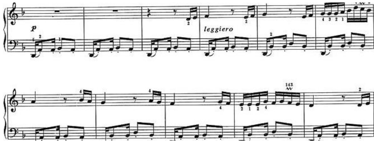
Рисунок 3 - Пример № 2

Непосредственная стилизация начинается с активного вступления характерного танцевального ритмического рисунка, который многократно повторяется в виде одной единственной синкопированной ритмоформулы: шестнадцатая восьмая, шестнадцатая две восьмых [Wang Chuen-Fung, 2013, 56-59].