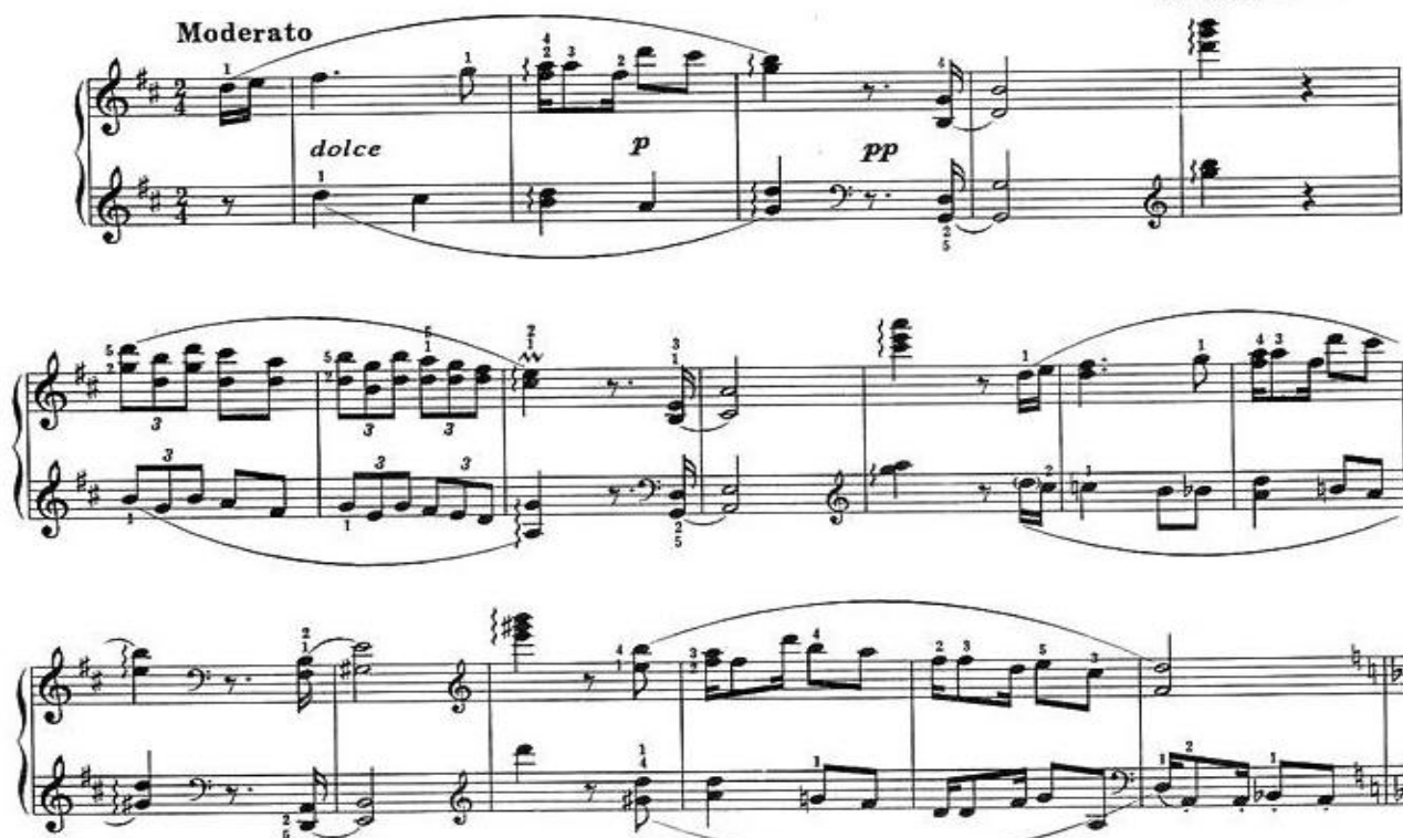
Рисунок 1 - Пример №1

В исполнении китайского виртуоза Ланг Ланга начало пьесы приобретает характер повествования, постепенного развертывания музыкальной мысли за счет утонченного пианистического туше и весьма тихой динамики. Его исполнение можно сравнить с исполнением музыки Шопена, кристальной чистотой и бриллиантовой пальцевой техникой. Ниже приведена потактовая схема формы данного сочинения, а также план (рис.2).