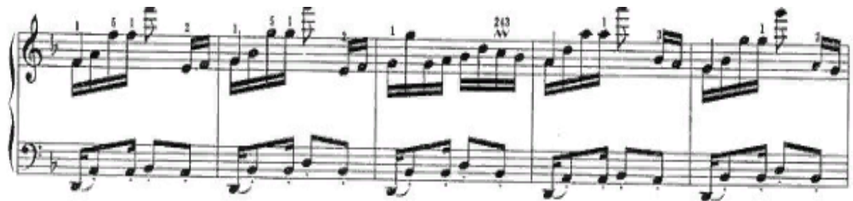
Рисунок 4 - Пример № 3

Ланг Ланг подчеркнуто исполняет первые два такта танцевального ритма, а затем четко разделяет верхний мелодический голос, придавая ему большей напористости и динамического развития. Пианист очень чутко улавливает опору на этнические образцы народной музыки и старается максимально показать в своем исполнении все характерные детали фольклорных танцевальных образцов. Кроме того, танцевальность проникает и в мелодическую линию правой руки, проявляясь в полетах и скачках на широкие интервалы в разные регистры.