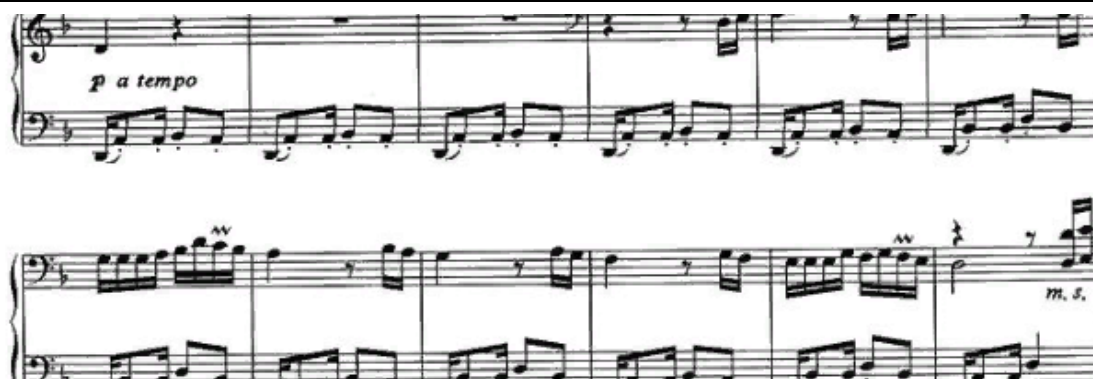
Рисунок 6 - Пример № 5

В заключительной части Ланг Ланг (несмотря на ремарку a tempo ) все-таки играет тот же материал существенно медленнее и без напора. Танец, заключенный в мелодии и ритмике, представляет собой лишь воспоминание, словно в черно-белых кадрах документальной киноленты всплывают народные гуляния, праздники и простые человеческие радости.