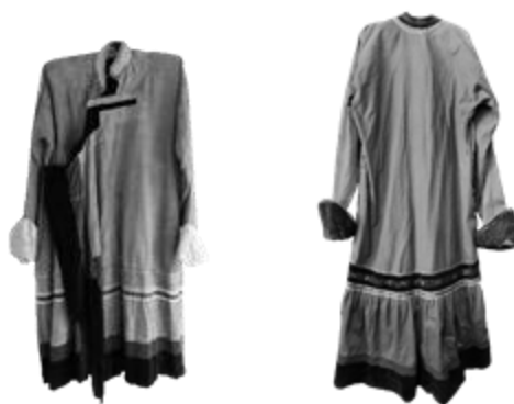
Рисунок 2 - Костюм рубежа XVIII–XIX вв.