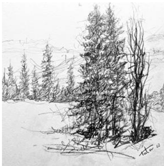
Рисунок 7 – Вот и зима. А. Татевосян. 2022. Мурманский областной художественный музей

февраля 2022 г. и продолжается по сегодняшний день параллельно с ведением архитектурной и преподавательской деятельности.