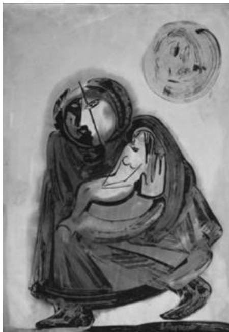
Рисунок 5 – Саам, несущий русалочку. А.А. Сергиенко. 2002 [Сергиенко, www]

Саам настолько бережно относится к русалке, что может говорить о том, как этот народ относится к своей культуре и насколько им важно ее сберечь.