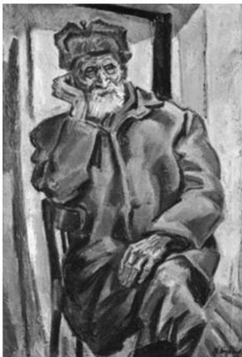
Рисунок 2 – Старый помор. В. Бубенцов. 1997. Мурманский областной краеведческий музей [Мосолова, 2009]

другие портреты местного населения можно увидеть, как просто жили поморы: в скромных жилищах, в обычной одежде и т.д. Также художником в своем творчестве воспевался тяжелый труд моряков, он писал и их портреты.