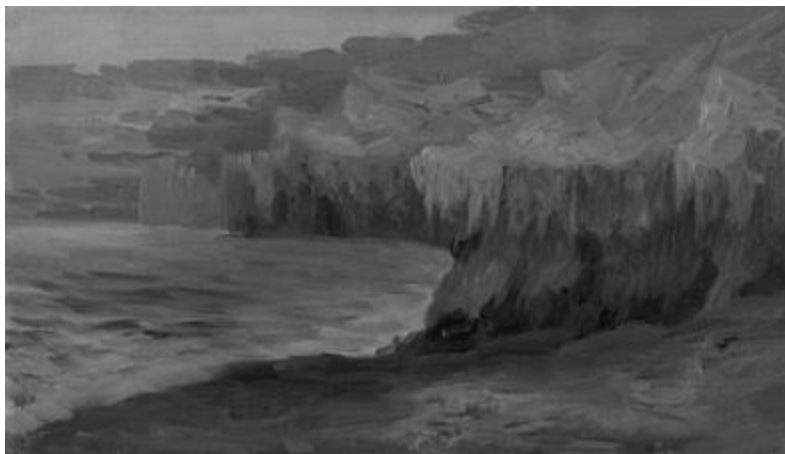
Рисунок 1 – Среди льдов. А. Борисов. 1896. Третьяковская галерея [Виртуальная галерея, www ]

на север, он видел их контраст, что получило отражение в картине.