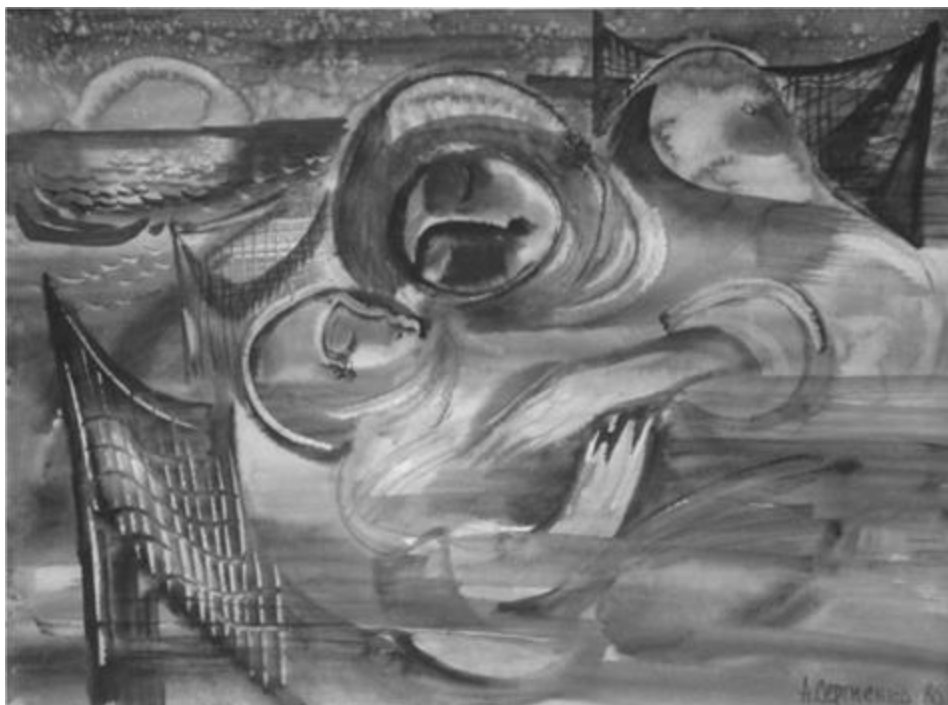
Рисунок 4 – Рождение рыбака. А.А. Сергиенко. 1986 г. [Сергиенко, www]

В сборнике его репродукций «Саамские акварели» [Сергиенко, www] можно встретить работу «Рождение рыбака» (рис. 4).