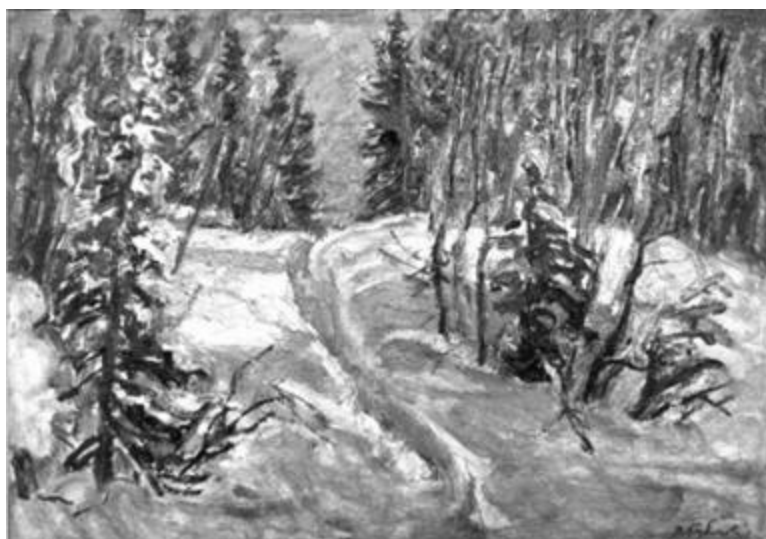
Рисунок 3 – Солнечный день. В. Бубенцов. 2009. Мурманский областной краеведческий музей [Мосолова, 2009]

В картине «Солнечный день» (рис. 3) В. Бубенцову удалось передать колорит северной зимы. Скудность цветовой палитры здесь совсем не ощущается благодаря не только редкому солнцу, но и умению автора передать малейшие тонкости оттенков северной природы.