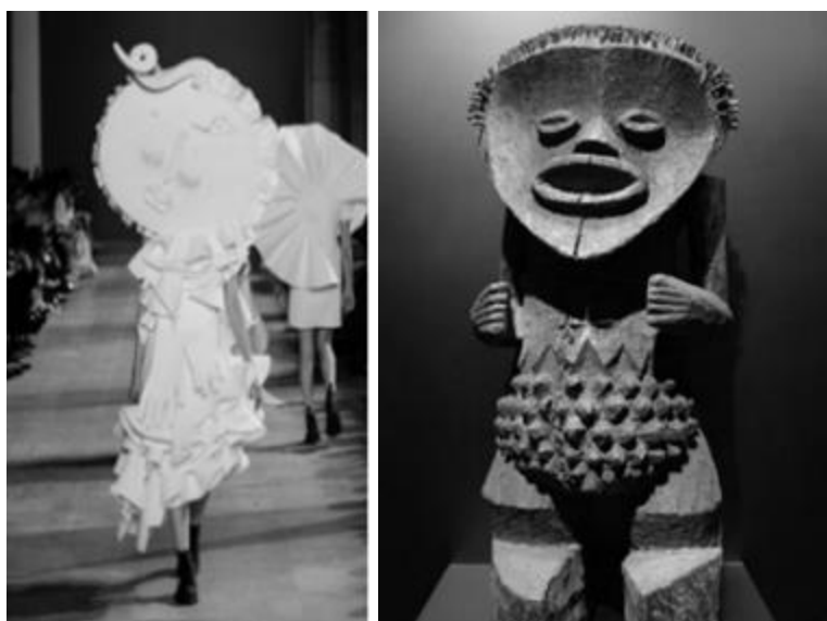
Рисунок 12 – Viktor & Rolf весна-лето 2016 Неделя Высокой Моды в Париже и фигура Мамбилы, Нигерия, Музей Бранли