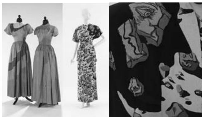
Рисунок 7 – Платья от Адриана 1940-е гг. Музей Метрополитен (Нью-Йорк)

В 1944–1945 гг. голливудский дизайнер Гилберт Адриан 23 (1903–1959) разработал стиль, который напоминал картины кубистов. Дизайнер создал платье под названием «Оттенки Пикассо» (рис. 7), в колорите насыщенных оттенков, синтетических соединениях ткани отчетливо читается обращение к произведениям кубистов.