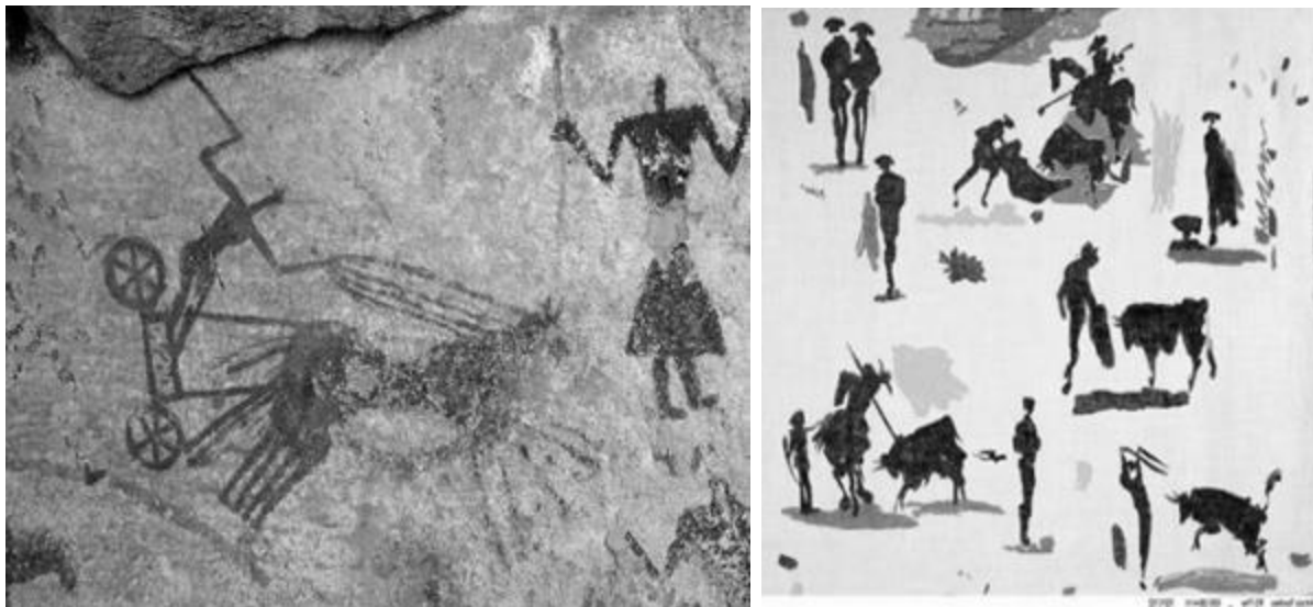
Рисунок 8 – Петроглиф. Пещера Манда Гуэли в горах Эннеди, северо-восток Чада и 'Toros у Toreros', Пабло Пикассо, рисунок на ткани, 1963 г.

В 1963 году он создает черно-белую ткань с изображением фавна, которая отображает мотивы африканской наскальной живописи. В орнаменте присутствуют сюжет с быками, а также рукописный текст. Художник часто использует черно-белую гамму и теплые оттенки красок. Помимо этого, в 1963 году Пикассо создает принт на хлопковой водонепроницаемой ткани, которую использует фирма White Stag 24 при производстве горнолыжной экипировки. Созданные художником принты пользуются спросом и на сегодняшний день.