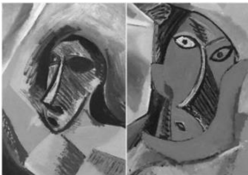
Рисунок 3 – Фрагменты картины «Авиньонские красавицы», 1907 год, музей современного искусства в Нью-Йорке

Данный аспект впоследствии оказал значительное влияние на систему фэшн-дизайна: ряд дизайнеров как XX, так и XXI века обращается к истории африканского искусства, черпая вдохновение из работ Пабло Пикассо: отражение творчества Пабло Пикассо можно обнаружить