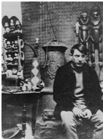
Рисунок 1 – Мастерская Пикассо на Монмартре. Африканские скульптуры. 1908 г.

Экспозиция «Picasso Primitif» 13 в Музее Бранли 14 раскрывает взаимодействие художника с «примитивным» искусством, включая работы, которые вдохновляли его, коллекционеров и дилеров, которых он посещал, а также аспекты, отраженные в его собственном творчестве. Помимо произведений самого художника, на выставке представлены документы, письма, фотографии и африканские артефакты из коллекции художника (рис. 1).