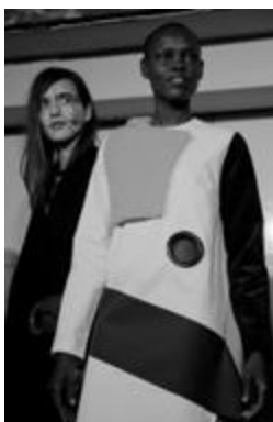
Рисунок 10 – Jacquemus autumn/winter 2015

Например, на показе модного дома Jacquemus 30 отсылкой к творчеству Пабло Пикассо стали нарисованные на моделях лица в профильном изображении, напоминающем лаконичный прием африканских статуэток (рис. 10).