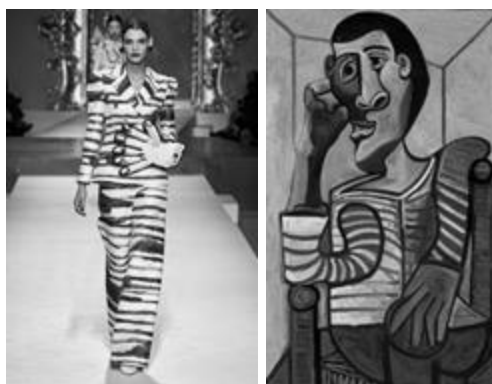
Рисунок 15 – Moschino весна-лето 2020 и «Моряк», Пабло Пикассо. Холст, масло, 1943 г., музей Бергрюна, Берлин