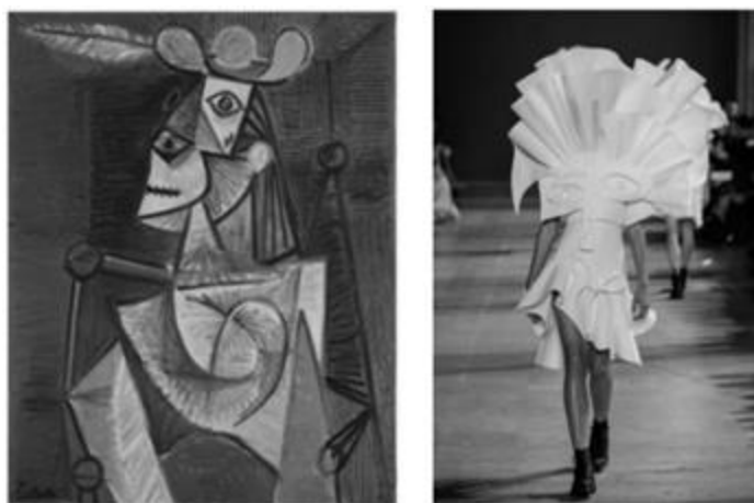
Рисунок 11 – Пабло Пикассо, «Женщина, сидящая в кресле». Холст, масло 1941 г., Государственный Эрмитаж и Viktor & Rolf, весна-лето 2016, Неделя Высокой Моды в Париже

Большой интерес обращения к творчеству Пабло Пикассо представляет коллекция haute couture сезона весна-лето 2016 голландского модного дома Viktor & Rolf 31 . Отказавшись от яркой цветовой гаммы, дизайнеры Виктор Хорстинг и Рольф Снурен работают с абстрактной эстетикой кубизма (Рис. 11, 12). Изделия напоминают африканскую скульптуру, будто бы вырезанную из белого камня. Искаженные пропорции полностью меняют привычный силуэт и переносят зрителя в совершенно иной мир, меняют ощущение пространства и времени, как это происходит в знаменитом полотне Пабло Пикассо «Герника» (рис. 13).