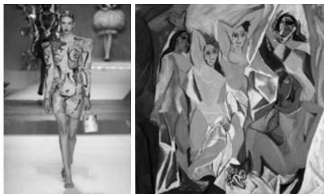
Рисунок 14 – Moschino весна-лето 2020 и «Авиньонские девицы», Пабло Пикассо. Холст, масло, 1907 г., Музей современного искусства в Нью-Йорке

Эпатажный кубистский стиль Пабло Пикассо также вдохновил арт-директора модного дома Moschino Джереми Скотта 32 на создание новой коллекции весна-лето 2020 (рис. 14, 15).