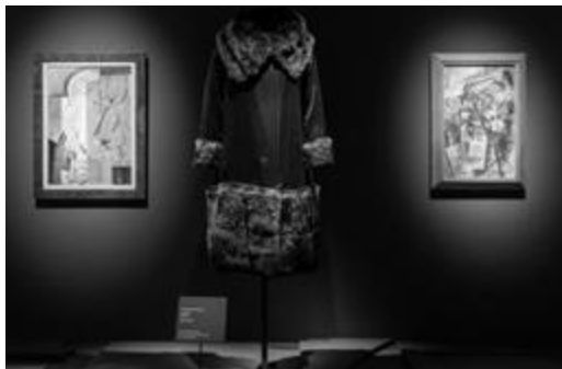
Рисунок 6 – Thyssen-Bornemisza Национальный музей, Мадрид. Выставка «Пикассо/Шанель»

году, приводит к сотрудничеству и рождению новых моделей одежды: в 1924 году они вместе разрабатывают дизайн декораций и костюмов для балета «Синий экспресс» Жана Кокто 22 (1889–1963). Полотна художника становятся частью мира моды и фоном, на котором «прямой» тип фигуры от Коко Шанель формирует образ новой женщины начала XX века. Уплощенная форма и крой изделий от Шанель, техника коллажа, соединяющая несочетаемые фактуры и материалы в костюмах к балету, реплицируется с синтетическим кубизмом Пабло Пикассо (рис. 6), так же, как и палитра оттенков, элементы декора и ритм паттерна. Так, Коко Шанель, используя геометрический язык кубистов, формирует новую реальность в женском костюме начала XX века.