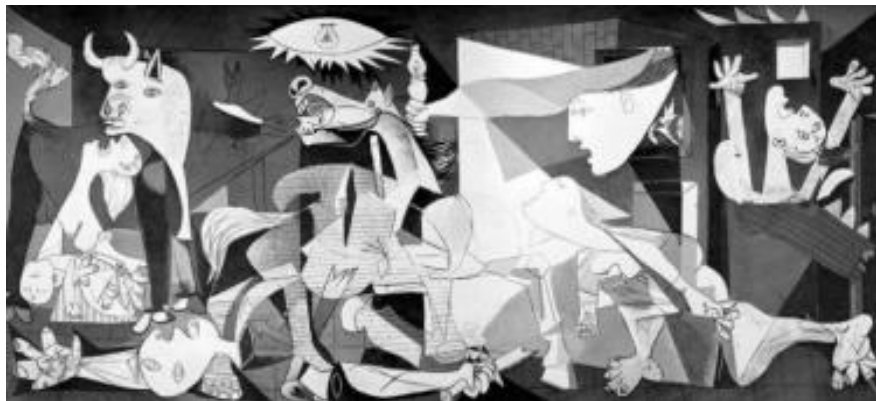
Рисунок 13 – Пабло Пикассо «Герника». Холст, масло, 1937 г., Центр искусств королевы Софии

Эпатажный кубистский стиль Пабло Пикассо также вдохновил арт-директора модного дома Moschino Джереми Скотта 32 на создание новой коллекции весна-лето 2020 (рис. 14, 15).