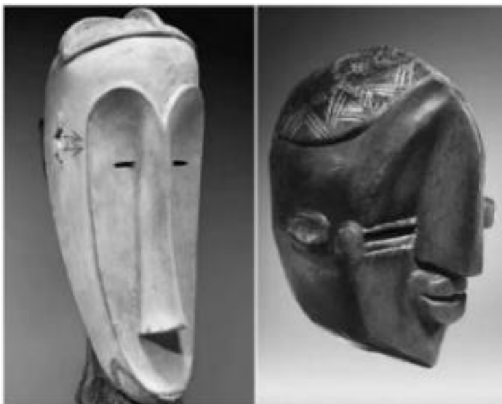
Рисунок 2 – Маска Нгила от народа Клыков и африканская ритуальная маска народности Lwalwa

Примитивные статуэтки, маски и идолы, в которых простые формы играли главенствующую роль, воплощали в себе могучую силу природы, находящуюся в поле поклонения первобытного человека (рис. 2). Произведения Пабло Пикассо постепенно все более и более становились похожими на африканских истуканов благодаря упрощенной форме (рис. 3).