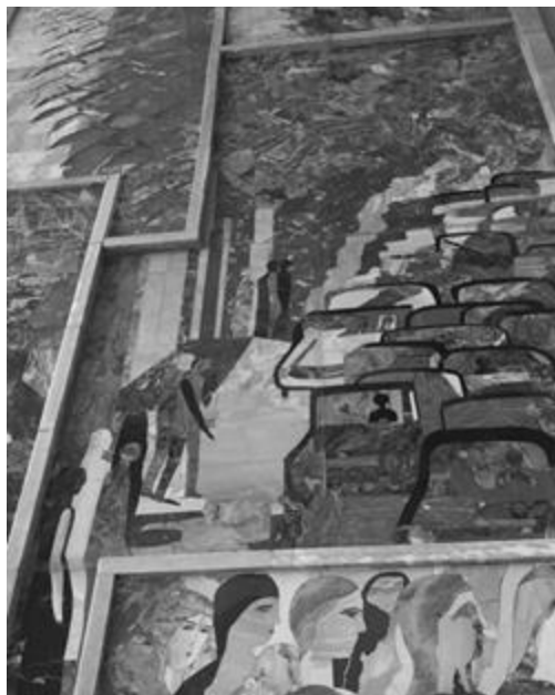
Рисунок 4 – Мозаика в фойе ДК и Т в городе Тольятти

интерес к поиску новых форм выражения и стремлению к обобщению.