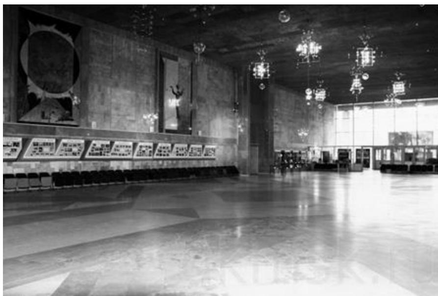
Рисунок 3 – Мозаика фойе ДК Московский