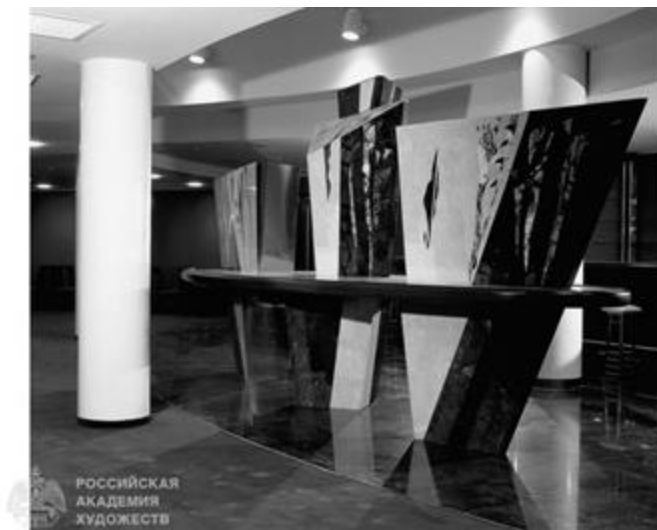
Рисунок 6 - Мозаика в фойе дома музыки в Москве

архитектуры, где основными материалами являются металлоконструкции и стекло. Данную объемно-пространственную композицию отличают условность изображения, стилизация, работа большими плоскостями – характерные приемы композиции Строгановской школы.