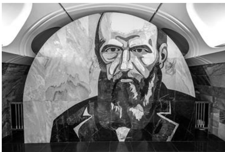
Рисунок 5 – Мозаика на станции метро Достоевская