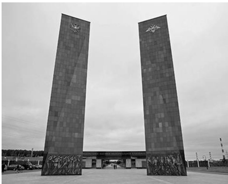
Рисунок 7 - Федеральное военное мемориальное кладбище

ФМПК свидетельствуют об усвоении приемов классического искусства, изучение которого всегда являлось важной частью подготовки молодых специалистов в области монументального искусства в РГХПУ им. С.Г. Строганова.