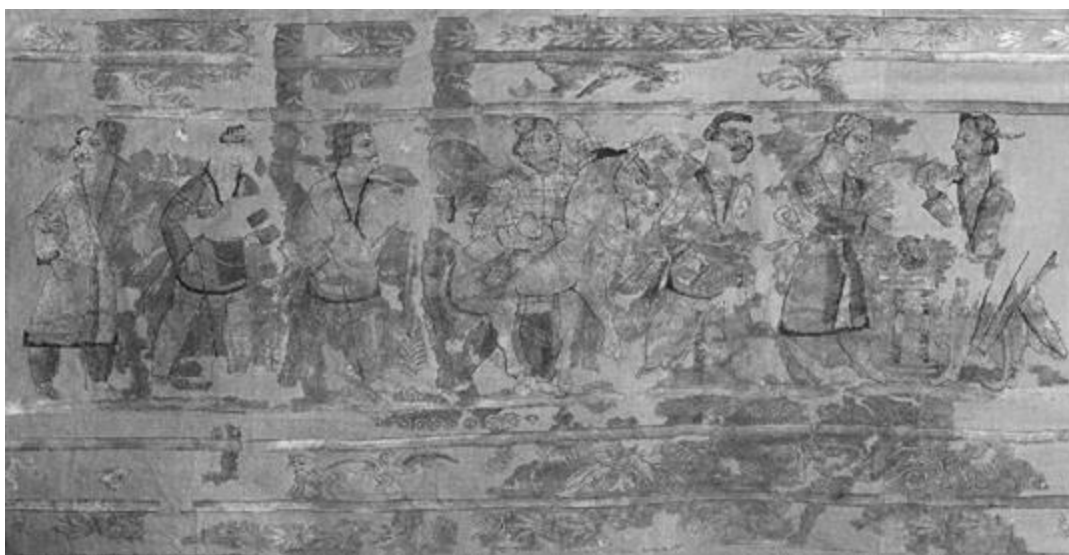
Рисунок 1 - Ковер, найденный во время раскопок хуннского могильника Ноин-Ула в Северной Монголии в 1924–1925 годах экспедицией П. К. Козлова.

Сегодня большинство якутских ученых считают, что в III-IV вв. на Среднюю Лену из Минусинской котловины через Предбайкалье прибыли хунны [Алексеев, Алексеева, Аргунов и др., 2020, с. 57]. Найденный в хуннском могильнике гор Ноин-Ула Монголии ковер I в. до н. э. – I в. н.э. по утверждению Н. В. Полосьмак персидского происхождения (рис. 1). Она предполагает, что перед алтарем стоит предположительно жрец, в руках которого гриб, который является основной составляющей священного напитка «хаома» или «сома», вызывающего божественное озарение и творческий экстаз ["Интересные факты", www ]. По нашему мнению, на ковре изображена хозяйственно-бытовая сцена из жизни хуннов – изготовление кузнецами тамги для клеймения лошади. Двое кузнецов поочередно бьют молотами по тамге в форме змеи, лежащей на наковальне. Такая тамга и сегодня служит монголам и тюркам. В руках кузнец держит не мухомор, а кузнечный молот.