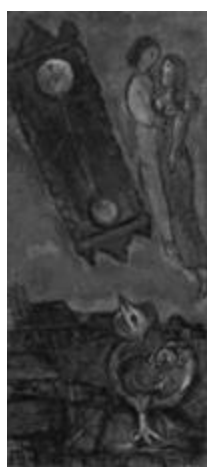
Рисунок 2 – Марк Шагал. «Часы на пылающем небе». 1947 г. Холст, масло. 69.7x30.5 см.