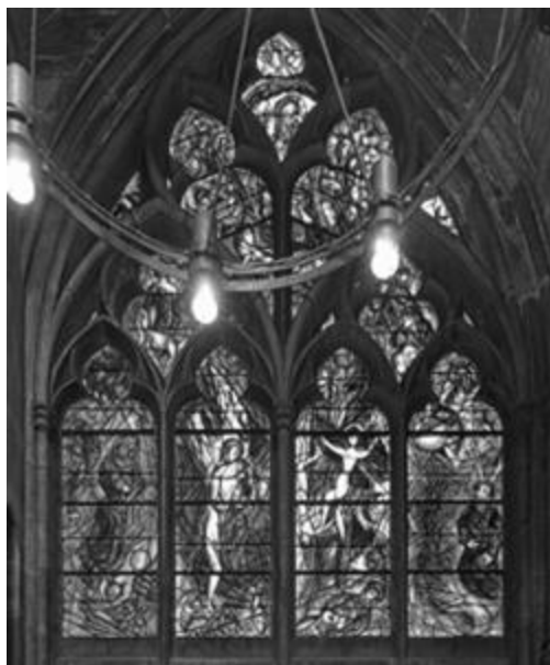
Рисунок 27 – Витражи Марка Шагала для собора святого Стефана, 1958-1968 г.

Кажется, что универсальным языком ультрамарина Шагал проповедует духовное вознесение и возможность связи с трансцендентным миром, которые в реальности возможны только в сновидениях (Рис. 29). Синий у Шагала становится не цветом, а, подобно сюжету фрески Мелоццо да Форли (Рис. 30), оживляющей воспоминания мелодией. «Теперь ваши цвета поют» [Шагал, 2021], — это были последние слова, сказанные Шагалу Леоном Бакстом.