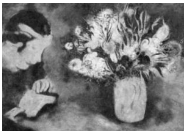
Рисунок 32 – Марк Шагал. «Белла в Мурийоне». 1926 г. Холст, масло. 47x65 см.