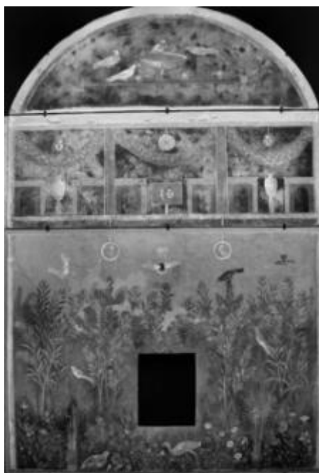
Рисунок 17 – Садовая комната: Древнеримская фреска из Дома Золотого браслета, Помпеи, восстановлена 62г. до н.э.

Так, посвященная Шагалу, сезонная коллекция модного дома Valentino весна-лето 2015 года, будто повторяет сложную палитру фирменных синих оттенков Джотто, мягкого света которой он добивался, покрывая слоями ультрамарина основу из азурита (Рис. 21).