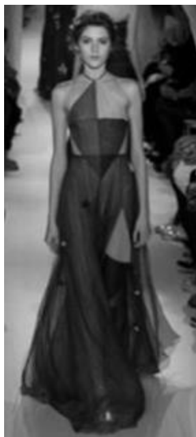
Рисунок 26 – VALENTINO SS 2015 г., Париж.