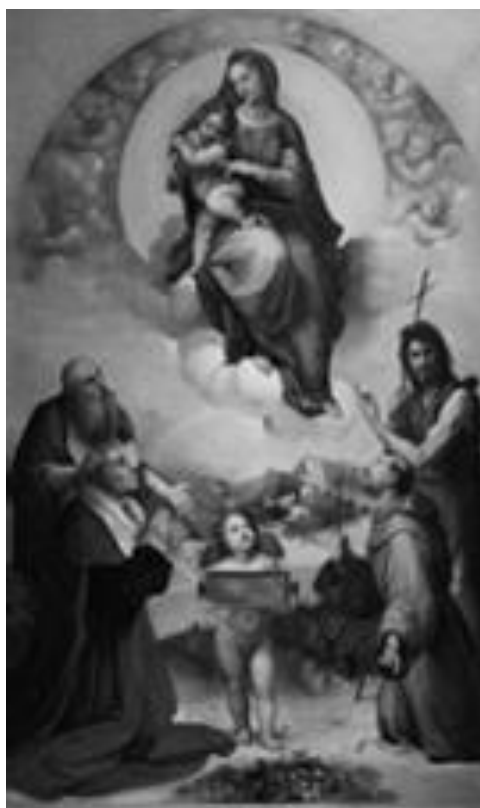
Рисунок 22 – Рафаэль Санти «Мадонна ди Фольнио». 1511-1512 гг., Ватикан. Дерево, масло. 320x193см.