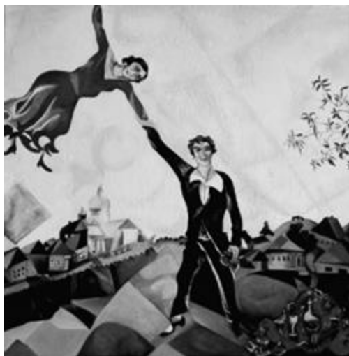
Рисунок 15 – Марк Шагал. «Прогулка». 1918 г. Холст, масло. 100x119 см.