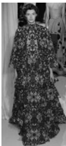
Рисунок 12 – VALENTINO SS 2015 г., Париж.