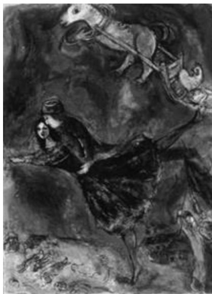
Рисунок 14 – Марк Шагал. «Влюбленные». 1944 г. Холст, масло. 78.1x57.5см.

Шагал использует свет как метафору устремления к горнему в гобелене «Сотворение мира» (Рис. 16): к библейскому свету, как к основе бытия, устремлены любимые художником парящие зооморфные фигуры - то ли лошади, то ли козы, а также птицы и рыбы. Встречающие их ангелы парят вокруг спирали солнца, вечное движение и энергия которой затягивает. Вертикальная ось гобелена показывает физику восхождения, переход земной материи к божественному духу, от видимого мира к небесному пространству. Расположенные в нижней части гобелена, фигуры Адама и Евы будто помещены внутрь глубокого синего фона на уровень кроны деревьев: такая композиция показывает земное притяжение их душ, находящихся в пространстве между мирами.