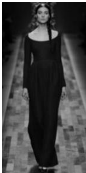
Рисунок 34 – VALENTINO RTW Fall 2013 г., Париж.