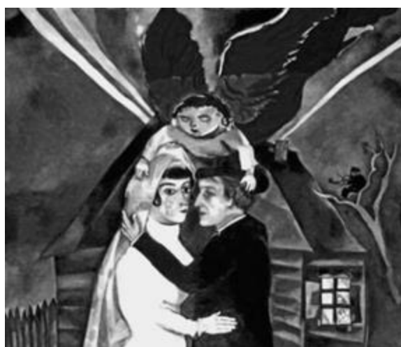
Рисунок 3 – Марк Шагал. «Свадьба». 1915 г. Холст, масло. 100x119 см.