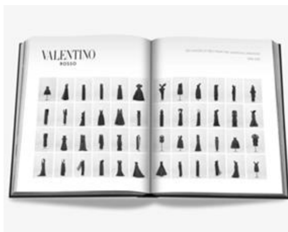
Рисунок 7 – Страница книги Valentino Rosso, 2022.

Так же, как и для Шагала - с самой первой секунды рождения, для модного дома Valentino - с самой первой коллекции (Рис. 4) - красный цвет становится метафорой биения его пульса и краской его души. Пронизывающий все коллекции Valentino красный снова и снова становится выразительной краской. Квинтэссенцией красного монохрома становится коллекция «Valentino. Red Show», продемонстрированная в 1999 году в Риме в честь сорокалетия модного дома (Рис. 5): состоящая из сорока платьев, фирменного оттенка Valentino Red, коллекция представляла его в шелке, кружеве, шифоне и бархате и др.