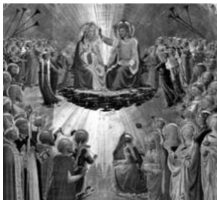
Рисунок 28 – Фра Беато Анжелико «Коронование Девы Марии», Флоренция, около 1430-1432гг. Темпера, дерево.