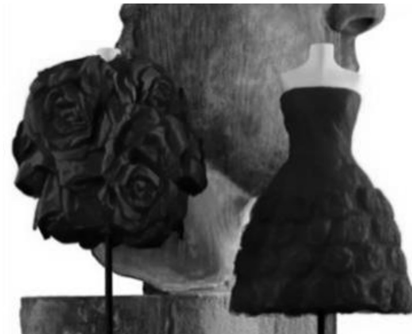
Рисунок 4 – Платье La Fiesta от Valentino, 1959.

Сцена, синтезирующая элегантность, драму и страсть, воплотилась в несущую конструкцию эстетики модного дома. Ставший фирменным оттенок Valentino Red без слов акцентировал природу женственности: «Все костюмы на сцене были красными. Все женщины в ложах были одеты в основном в красное. Сидения и портьеры были красными. И я понял, что после черного и белого нет более прекрасного цвета» [ The history of Valentino Red dresses , 2023]- говорил Валентино.