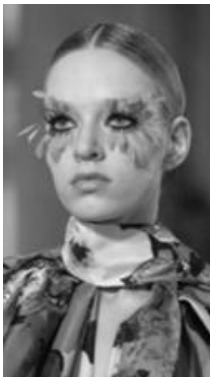
Рисунок 19 – VALENTINO SS Couture 2019 г., Париж.