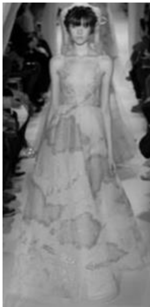
Рисунок 25 – VALENTINO SS 2015 г., Париж.