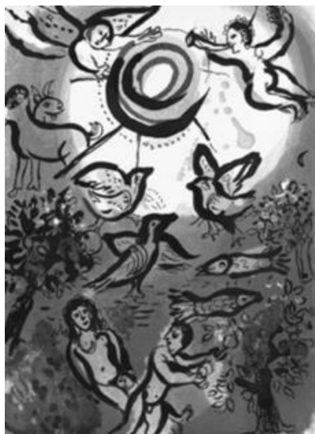
Рисунок 16 – Гобелен Марка Шагала «Сотворение мира», 1971 г. Частная коллекция. Выставка в Новом Иерусалиме 07.03.2020.

Идея стремления к духовному и возвышенному созвучна модному дому Valentino, эстетика которого сформирована на Римской традиции, так же немислимой без концепции полета. Рим Valentino невозможно представить без Фонтана Треви, киностудии Cinecittà, Испанской лестницы и Собора Святого Петра, рядом с которым великий Леонардо да Винчи обдумывал схемы механики полета.