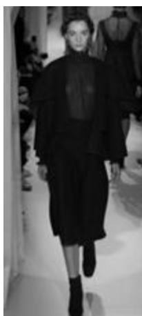
Рисунок 11 – VALENTINO SS 2015 г., Париж.