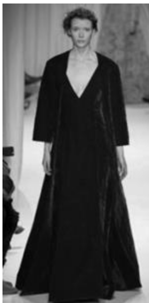
Рисунок 8 – VALENTINO SS 2015г., Париж.

Вот почему коллекция Valentino сезона весна-лето 2015 года будто материализует субстанцию красного с картин Шагала: синтезируясь с энергией художника, дизайнеры передают температуру «Горящего дома» (Рис. 1), времени пылающего неба (Рис. 2) и т.д. мерцанием бархата (Рис. 8), легким трепетом шифона (Рис. 10), рельефами венецианского гипюра «Бурано» (Рис. 12), переливами шелка и объемом аппликации из сухой шерсти, изображающей солнце цвета с самой длиной цветовой волной (Рис. 13).