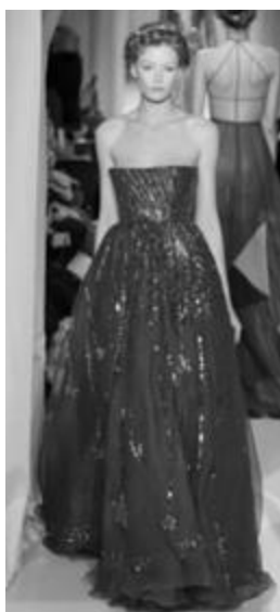
Рисунок 24 – VALENTINO SS 2015 г., Париж.