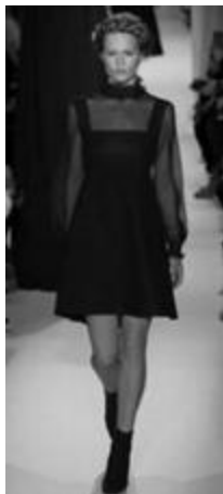
Рисунок 10 – VALENTINO SS 2015 г., Париж.