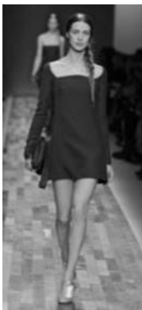
Рисунок 35 – VALENTINO RTW Fall 2013 г., Париж.

Любимый модным домом Valentino насыщенный синий оттенок – это путешествие вглубь истории (Рис. 34), в эпоху царственных силуэтов, роскошных фактур и насыщенного колорита величественных одежд аристократии (Рис. 35).