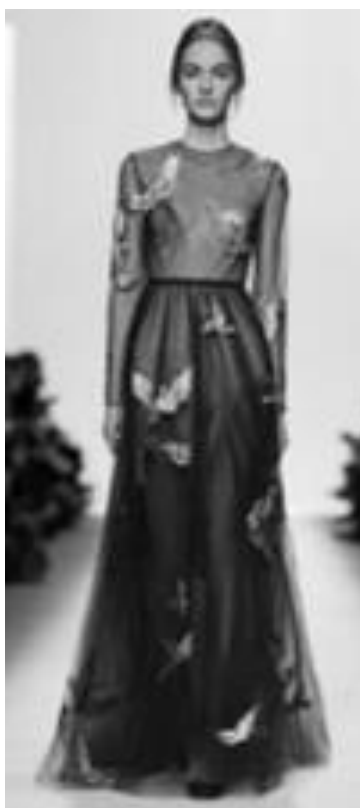
Рисунок 20 – VALENTINO FW 2014 г., Париж.