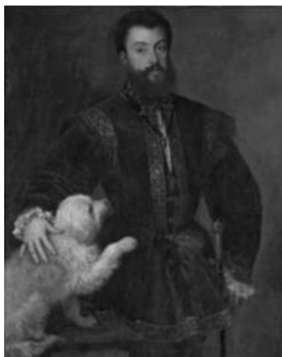
Рисунок 33 – Тициан Вичеллио «Портрет Фредерико II Гонзара, герцога Мантуанского». 1529 г. Дерево, масло.