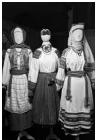
Рисунок 36 – Праздничные костюмы женщин Западного полесья.

Многослойность белорусского костюма передана через национальный орнамент с преобладанием растительных и «брокеровских» (декоративный орнамент, создававшийся по готовым схемам, выпускаемых фирмой Брокер и Ко в конце XIX и начале XX века преимущественно на территории России и современной Беларуси. Такие узоры отличались яркостью и сочетанием цветов, рассчитанных на массовое использование в домашних рукодельных наборах.) узоров в колорите белого, красного (Рис. 39) и черного (Рис. 40).