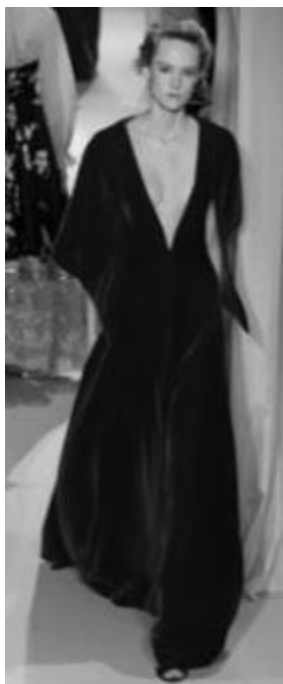
Рисунок 9 – VALENTINO SS 2015 г., Париж.