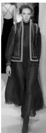
Рисунок 39 – VALENTINO SS 2015 г., Париж.