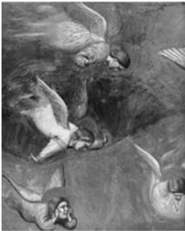
Рисунок 21 – Джотто ди Бондоне «Оплакивание Христа». 1306 г. Падуя. Фреска. 185x200см.