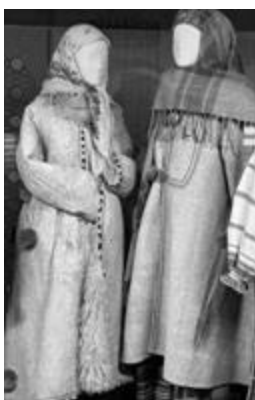
Рисунок 37 – Верхняя одежда женщин Западного полесья.