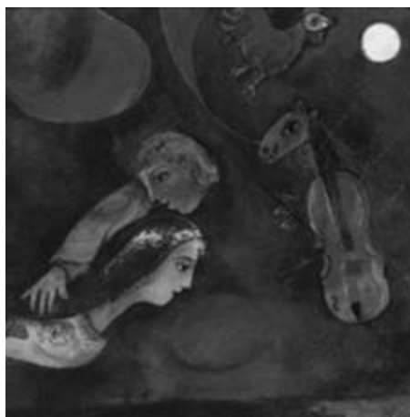
Рисунок 31 – Марк Шагал. «Красный петух в ночи». 1944 г. Холст, масло. 68.6x79.4 см.