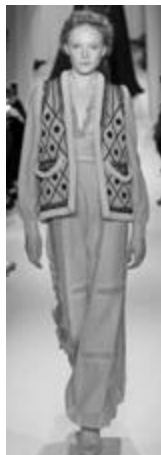
Рисунок 38 – VALENTINO SS 2015 г., Париж.