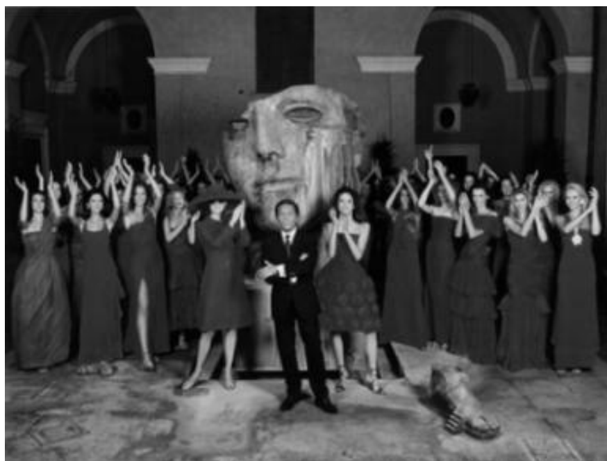
Рисунок 5 – 40 красных платьев Valentino в честь 40-летия бренда, 1999.