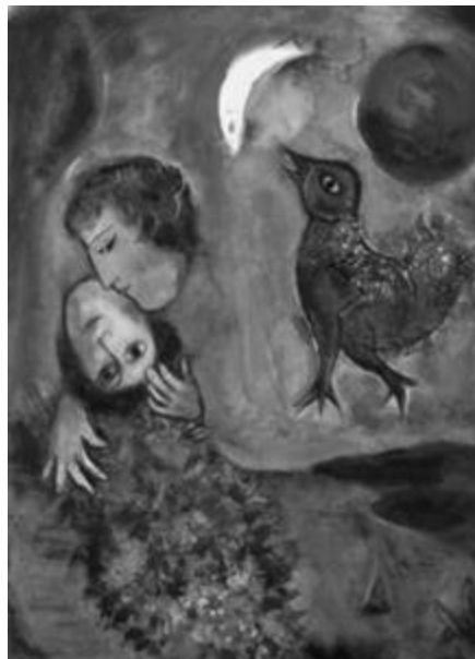
Рисунок. 29 – Марк Шагал. «Пейзаж в синем». 1949 г. Бумага, гуашь. 77x56 см.