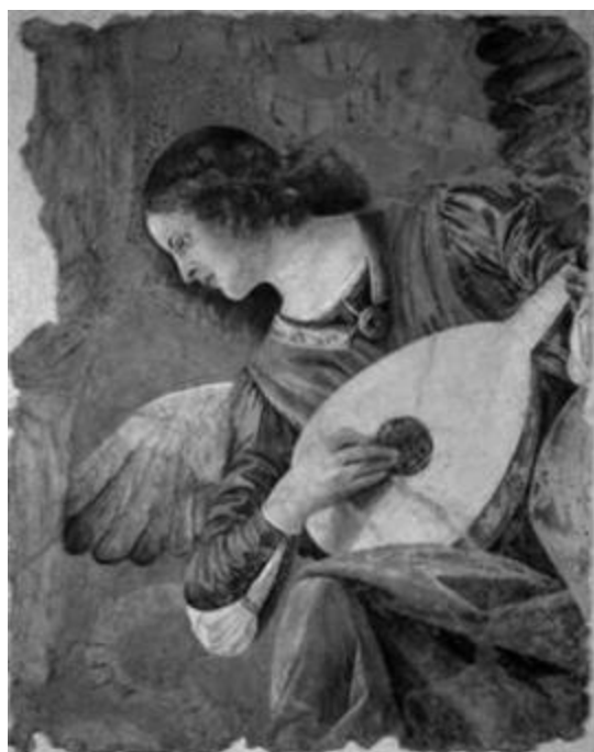
Рисунок 30 – Мелоццо да Форли «Ангел, играющий на лютне», музей Ватикана, Рим, около 1480 г. Фреска. 117x93.

Оттенки ночной небесной синевы, пробуждающей нежные чувства, близки эстетике модного дома Valentino. Но если у Шагала синий цвет где-то между сном и явью и пробуждает воспоминания об утреннем крике петуха (Рис. 31) или запахе сорванных цветов (Рис. 32), для пропитанного римской историей дома - синий цвет связан с историзмом и благородством синих одеяний правителей и герцогов, изображенных на портретах итальянских художников Возрождения (Рис. 33).