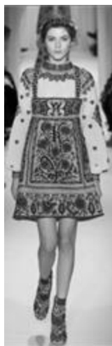
Рисунок 40 – VALENTINO SS 2015 г., Париж.