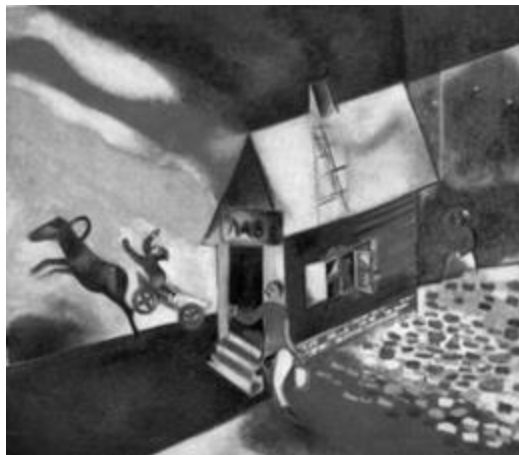
Рисунок 1 – Марк Шагал. «Горящий дом». 1913 г. Холст, масло. 107x120.6 см.