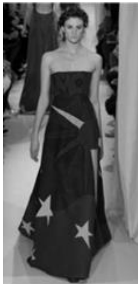
Рисунок 13 – VALENTINO SS 2015 г., Париж.

Как и современники Шагала, дизайнеры модного дома видят в нем поэта цвета: сюрреалисты воспринимали палитру Шагала как «язык грез», сна и подсознания, Гийом Аполлинер отмечал «поэтический свет», сказочность и музыкальность его красок.