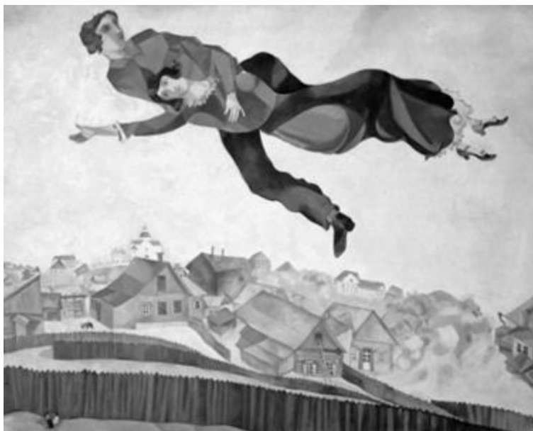
Рисунок 23 – Марк Шагал. «Над городом». 1918 г. Холст, масло. 141x197 см.

Платья коллекции становятся холстами, на которых разворачивается история мечты Марка Шагала. Дизайнеры модного дома интерпретируют близкую художнику концепцию детской чистоты восприятия мира - неперемного условия для вознесения (Рис. 23). Так, будто напоминая слова Нового Завета «...если не будете как дети, не войдете в Царство Небесное», дизайнеры создают платье с завораживающим мерцанием золотых звезд на глубоком синем небе (Рис. 24), платье с невесомыми мотивами облаков (Рис. 25), платье с иконографией воздушного змея (Рис. 26) и др.