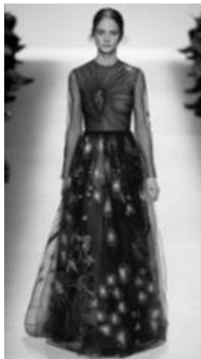
Рисунок 6 – VALENTINO Ready-to-wear Fall Winter 2014, Париж.