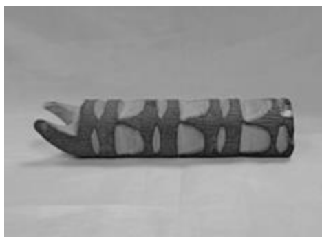
Рисунок 13Б – Корова (талах ынах) Начала XX века. Музейный экспонат Маганинский наслег Горного улуса