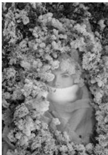
Рисунок 8 – GAPANOVICH коллекция – «Секретики», осень-зима, 2024 г.