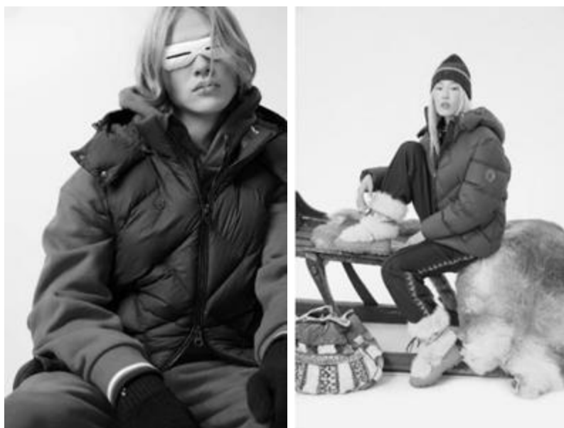
Рисунок 20 – BOSCO зимняя коллекция BOSCO YAMAL, 2025.

Так, коллекция BOSCO YAMAL – как манифест северной идентичности – транслирует особую ценность культурной аутентичности Севера.