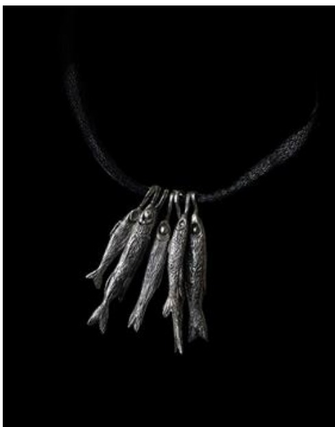
Рисунок 14 – RADAKINA «Северный улов». Коллекция – Сердце Севера, 2025.

Якутский ювелирный дом SOKOLNIKOV в коллекции «Каникулы у Эбээ» (Рис. 16) 2023 года рефлксирует на тему якутского детства. Национальные предметы домашнего быта, воплощенные в символы традиций – ытык – мутовка для взбивания сливок, дьэдьэн – земляника – буквально метафоры ностальгии по детству. Но центром коллекции становится особо почитаемый у народа Саха огонь – «камелек» (Рис. 17). В ювелирных изделиях дизайнеры стилизовали и адаптировали важные национальные символы, знакомые народу саха с детства.