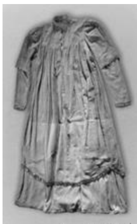
Рисунок 11 – MUUS свадебная коллекция, весна-лето, 2025 г.