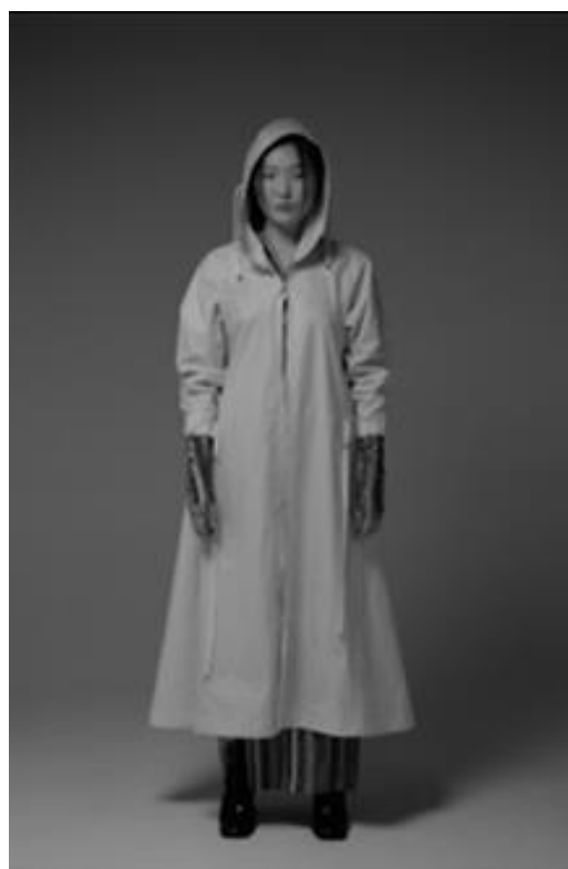
Рисунок 21Б – Пальто EIKIRIE