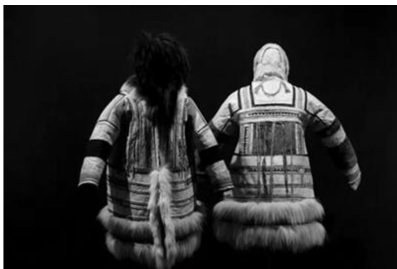
Рисунок 2 – Национальная одежда нганасан. Выставка «Таймыр. Гений места». Всероссийский музей декоративного искусства, 2019 г.

Подобно тому, как выставка 1910-х, став источником вдохновения для многих художников, оказала серьезное влияние на появление новых направлений в искусстве: «В Петербурге началась мода на Арктику, это отразилось в материалах прессы и в массовой культуре» [Зеленский, 2019], выставка «Таймыр. Гений места» 2019 года, благодаря кураторскому взгляду К. Н. Гаврилина, заново открыла утраченный феномен Арктического Севера, показав его важную роль в динамичных процессах русского авангарда XX века.