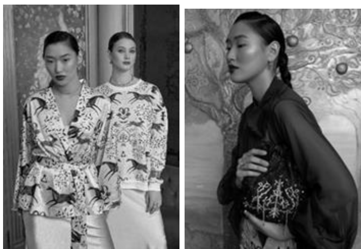
Рисунок 18 – AIYMNY коллекция «Сказ про алаас», 2024 г.

Якутский модный дом AIYMNY выполняет миссию культурного проводника. Он не архивирует фольклор, а вплетает его в ткань, через поэзию «Сказа про алаас» и монументальность «Ленских столбов» модный дом доказывает, что традиция – это не застывшая форма, а продолжение глобальной истории, прошлое становится соавтором будущего, а наследие – актуальным трендом, не подвластным времени.