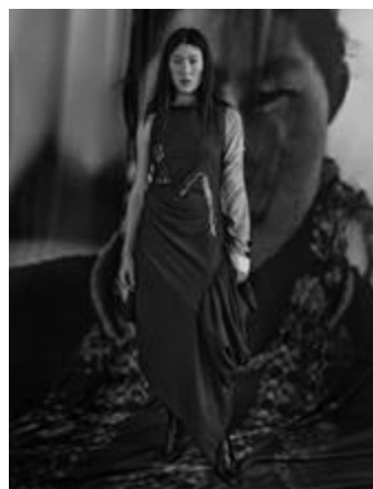
Рисунок 12 – Якутское платье. MUUS «Коллекция 11», весна-лето, 2023 г.

Эту же философию, но уже в драгоценном материале воплощает ювелирная мастерская из Якутии MG DIAMOND, соединяющая традиции Якутии с ювелирным искусством: ювелиры интерпретируют формы традиционных игрушек и оберегов в украшениях, воссоздавая мотивы якутской мифологии детства и связь с природой.