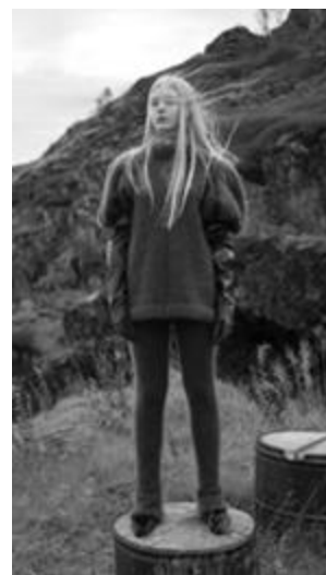
Рисунок 9 – GAPANOVICH коллекция – «Слияние», весна-лето, 2022 г.