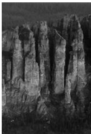
Рисунок 19А – «Ленские столбы» объект всемирного наследия ЮНЕСКО