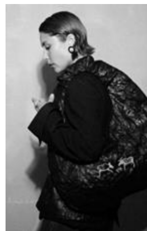
Рисунок 19Б – AIYMNY коллекция «Ленские столбы», 2025 г.