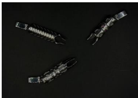
Рисунок 13А – MG DIAMOND Кулон Бык «Талах ынах», 2025 г.

Например, привычный с детства якутский нож становился в руках ребенка первым инструментом для творчества, с помощью которого рождались незамысловатые, но наполненные смыслом игрушки. Так, вдохновением для кулонов 2025 года становится «талах ынах» – это игрушка, напоминающая корову, которая пасется в алаасе (Рис. 13) – такую зооморфную фигурку ребенок может создать за считанные минуты простым якутским ножом.