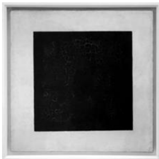
Рисунок 3 – Казимир Малевич. «Черный квадрат». 1915 г. Холст, масло. 79,5x79,5 см.

Так, если многие течения западно-европейского искусства начала XX века формировались благодаря примитивизму Африканской эстетики, близость с которой стала результатом французской колонизации Африки: « В начале XX века множество художников, среди которых были Андре Дерен, Пабло Пикассо, Анри Матисс и Амадео Модильяни, заинтересовались искусством Африки и начали посещать музей Трокадеро в Париже, чтобы полюбоваться на уникальные абстрактные формы. Это увлечение способствовало тому, что художники вышли за пределы натурализма... Состояние изобразительного искусства кардинально изменилось, и в результате возник кубизм, вдохновленный упрощенным подходом африканского скульптора к использованию плоскостей и форм.» [Сысоев, Брантова, 2024], то искусство русского авангарда и модернизма, участниками которого стали Казимир Малевич, Николай Суетин, Василий Ватагин, Франциско Инфанте, Вячеслав Колейчук, и творения современных художников медиативных инсталляций: Константин Худяков, Егор Плотников, Мила Введенская, а также первый долганский художник Борис Молчанов тесно связаны с культурой коренных народов Севера. Так, фактором, оказавшим влияние на появление супрематизма, начавшегося с «Черного квадрата» Малевича (Рис. 3), стала национальная одежда нганасанов, выражающая абстрактную форму мышления народов Севера.