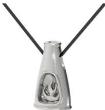
Рисунок 17 – SOKOLNIKOV «Камелек». Коллекция – Каникулы у Эбээ. Каникулы у Бабушки.

В мире, в котором мода все чаще обращается к истокам, якутский дом AIYMNY, творит не просто одежду, а материализованную легенду. Фольклорный дизайн оживает в диалоге якутского орнамента с цифровыми техниками: «Самые архаичные орнаменты Таймыра, созданы нганасанами и энцами. Орнаменты ненцев и эвенков также имеют очень древнее происхождение. Они наделены глубоким смыслом, выражая в абстрактной форме представление о мироздании и всем, что его составляет» [Всероссийский музей декоративного искусства, 2019].