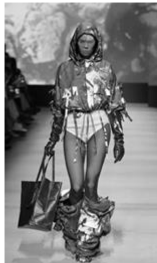
Рисунок 7 – GAPANOVICH коллекция – «Эвдиалит», осень-зима, 2025 г.