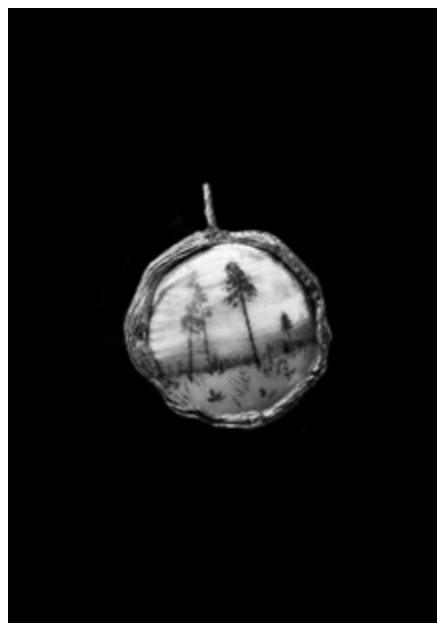
Рисунок 15 – RADAKINA «Безмолвие». Коллекция – Тоска, 2025.