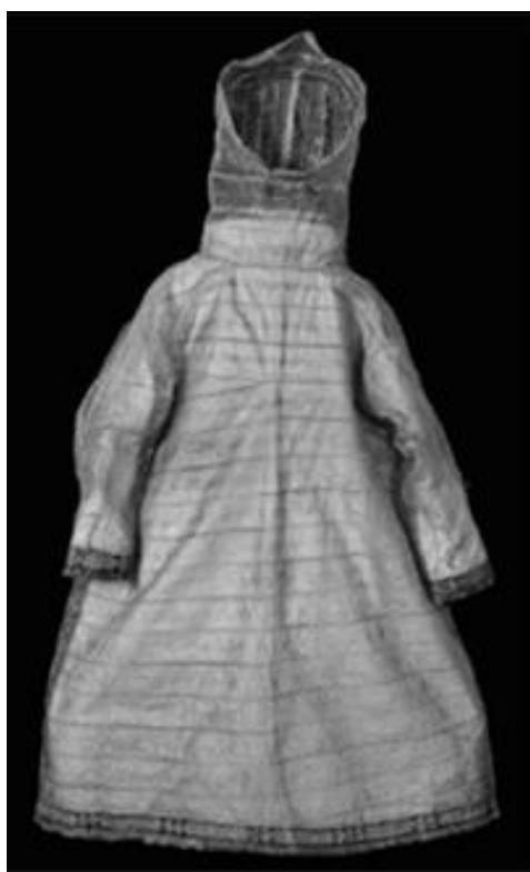
Рисунок 21А – Пальто с капюшоном из тюленьих кишок, Алеутские острова, Аляска