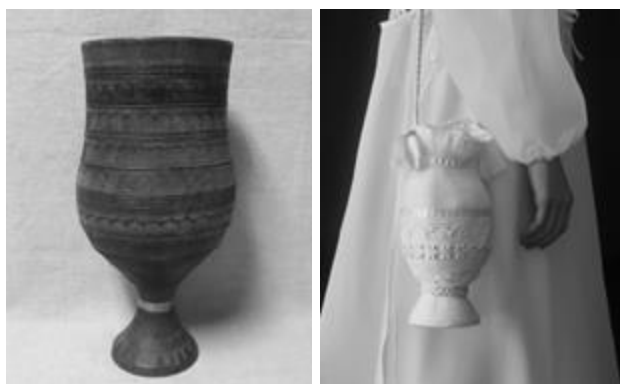
Рисунок 10 – Якутский сосуд чороон.