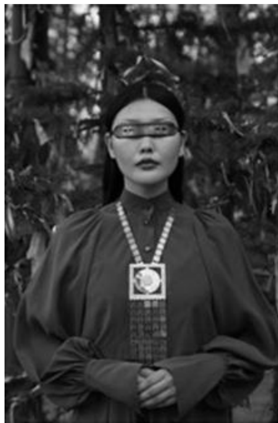
Рисунок 22Б – Платье EIKIRIE.