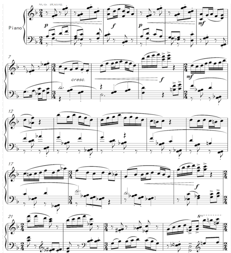
Рисунок 1 - Гэ Цин, Соната №12 «Жунцянь», 1 ч.

В первой части сонаты этот принцип проявляется с максимальной ясностью. Главная партия, основанная на цюпай «Каньсян» (также известном как «Майянтао»), представляет собой не просто тему, построенную в китайском ладе F-гун, а цитирование целостного культурно-звукового кода. Этот цюпай, восходящий к выкрикам уличных торговцев конца XIX — начала XX веков и ставший в миньцзюй лейтмотивом комических, проворных персонажей из простонародья, несёт в себе готовый смысловой комплекс: образ оживлённой рыночной суеты, полушутливого торга и народного юмора. Гэ Цин осуществляет не «развитие темы», а транскрипцию и насыщение этого кода средствами фортепиано: пунктирные ритмы и стаккато имитируют отрывистые выкрики; «зыбкое» чередование лада «шан» от ноты до и лада «гун» от ноты си-бемоль (тт. 16-22) передаёт интонационную неустойчивость и диалогичность улицы; а наложения больших и малых секунд создают специфическую «шероховатую» звуковую фактуру, отсылающую к многоголосию рыночной площади (Рис. 1). Таким образом, главная партия функционирует как семантически насыщенная единица «народно-бытового пласта».