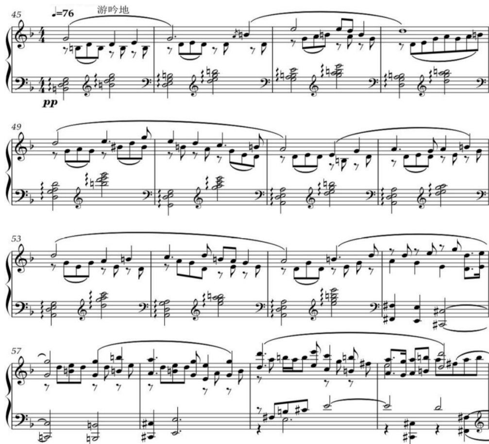
Рисунок 2 - Гэ Цин, Соната №12 «Жунцянь», 1 ч.

виде покачивающихся арпеджио вызывает ассоциации с мерным колокольным перезвоном (Рис. 2). Контраст с главной партией — это не просто смена лада или темпа, а столкновение двух взаимоисключающих эмоциональных и социальных миров: публичной рыночной суеты и интимной ночной меланхолии.