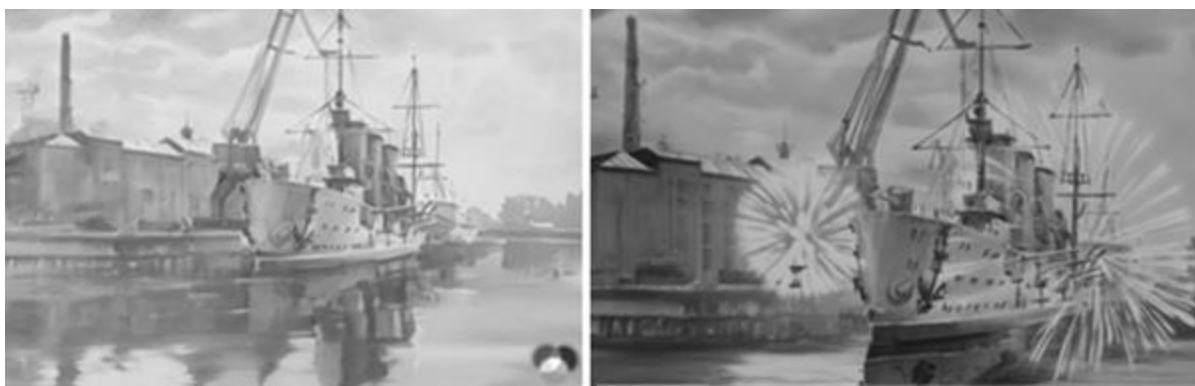
Рисунок 12- Раскадровка анимации, выполненная с помощью программы LUMA AI (анимация движения камеры вправо, анимация волн и отражения)