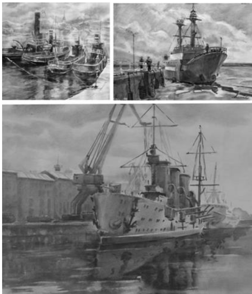
Слева вверху «Финские пароходы на Неве» Справа вверху «Ирбенский маяк» Внизу: «Кронштадтский Морской завод»

На рисунках 12-14 представлены скриншоты видео достроенных искусственным интеллектом анимации по ключевым словам, «движение воды», «достроить здание завода».