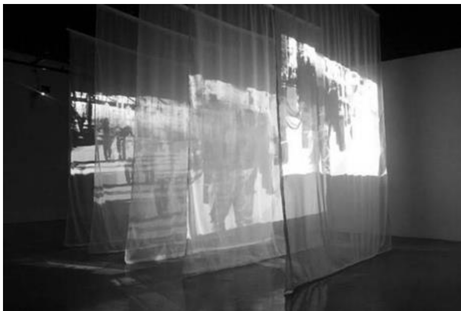
Рисунок 9 - Проекционный мэппинг, выполненный студентами кафедры компьютерной графики и дизайна СПбГИКиТ, спектакль «Зеленая гусыня»