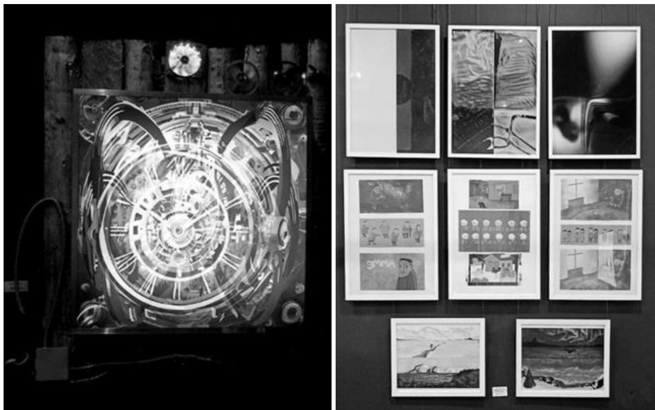
Слева: Инсталляция: ХРОНОС XXL.178 (авт. Илларион Коньков)

Если проанализировать то, что интересно зрителю, опираясь на опыт, можно отметить, что самые интересные объекты те, что, вызывают отклик в сознании в виде ассоциации, чувств, эмоций. Например, на основе традиционного коллажа, но с использованием компьютерной графики, на основе живописи, но сделанной в компьютерных программах и т.д. – точнее, произведения смешанного типа (рис.2).