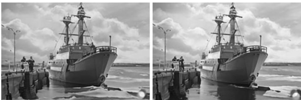
Рисунок 13- Раскадровка анимации, выполненная с помощью программы LUMA AI (анимация салюта и движения корабля на камеру)