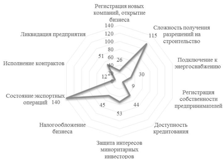
Рисунок 1. Ранги России по основным аспектам ведения бизнеса в 2017 году по данным исследования Всемирного банка 2

ся на 28% по сравнению с 2014 годом и составив 5,5 трлн руб. Размер портфеля кредитования снизился на 6% до 4,8 трлн руб. Негативная динамика обусловлена прежде всего снижением активности на рынке кредитования 30-ти крупнейших банков, на которые приходится порядка 52% т совокупного объема кредитов, выданных малым и средним предприятиям.