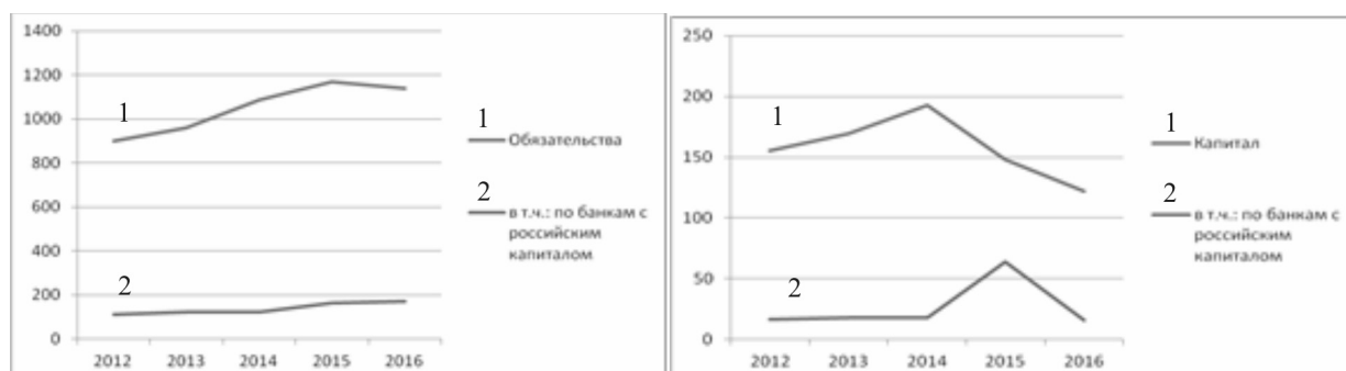
Рисунок 2. Динамика обязательств и капитала банков Украины (по состоянию на начало года), млрд гривен

Анализ показывает, что в неблагоприятных условиях оттока депозитов, закрытия филиалов и отделений банки с российским капиталом обеспечили прирост ресурсной базы за счет увеличения обязательств на 32,6% в 2014 году и на 4,9% в 2015 году. В то же время в целом по банковской системе в 2015 году наблюдалось сокращение обязательств на 1,5%.