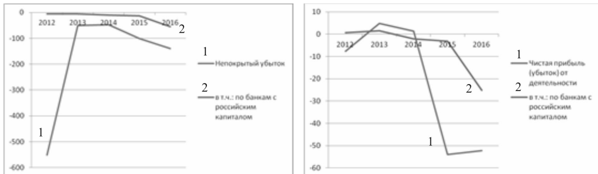
Рисунок 3. Динамика прибыли банков Украины (по состоянию на начало года), млрд гривен

На рис. 3 представлена динамика финансовых результатов деятельности банков Украины.