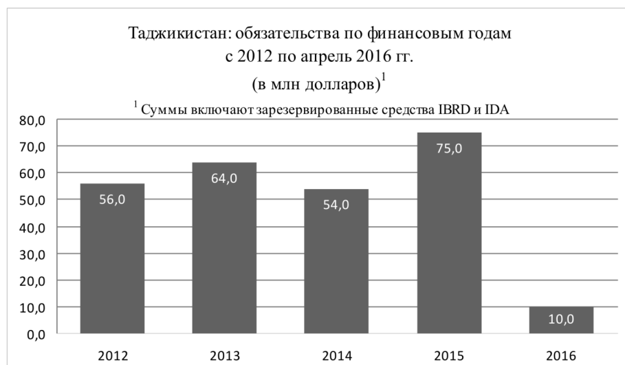
Рисунок 4. Данные по кредитованию Таджикистана за период 2012 – (апрель) 2016 г.

Всемирным банком прогнозируется существенное замедление экономического роста Таджикистана в среднесрочной перспективе, с очень постепенным восстановлением сектора малого и среднего бизнеса, что ставит государственные реформы по сокращению бедности в Таджикистане и результаты государственной политики за последнее десятилетие под угрозу. Данная тенденция сохранится в среднесрочной перспективе, соответственно, этот фактор наиболее важен для государственной политики Таджикистана в макро – и микроэкономике, в структуре реформ, необходимых для создания новой основы внутреннего инклюзивного роста малого и среднего предпринимательства [Каюмова, 2015]. Нынешнюю ситуацию следует рассматривать как возможность реформировать экономику республики, внедрять новые механизмы роста – частные инвестиции и экспорт – для того, чтобы создать больше высокооплачиваемых рабочих мест в стране.