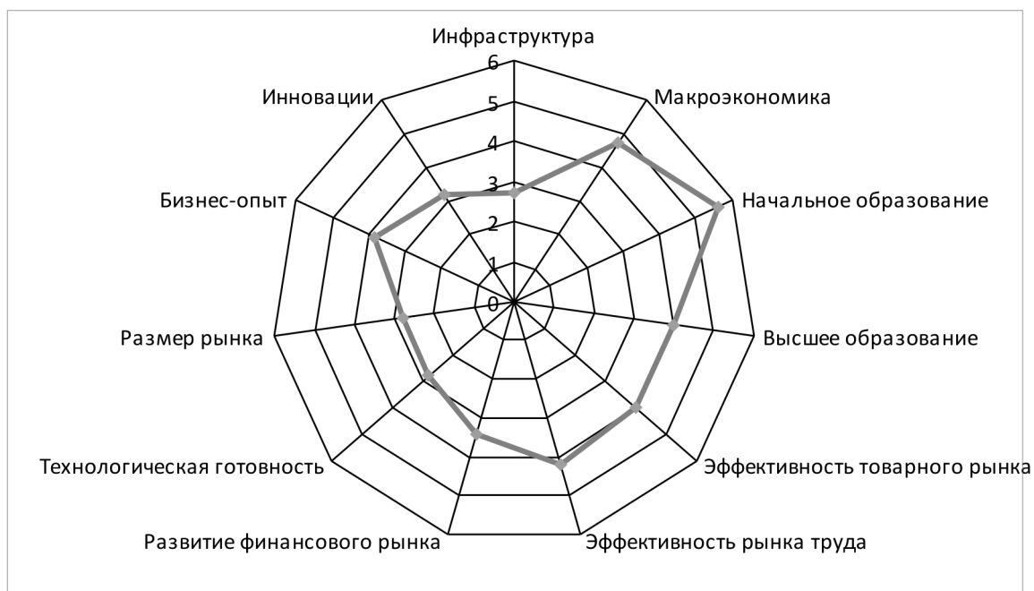
Рисунок 2. Основные показатели глобального индекса конкурентоспособности экономики Таджикистана по состоянию на 2015 год

Таджикистан является страной с развивающейся экономикой, членом группы А, имеет доступ к льготному кредитованию для экономической поддержки. Уровень конкурентоспособности Таджикистана, согласно глобальному индексу по состоянию на 2015 г., составляет 3,9 балла из 7 возможных (см. рис. 2) [Отчет..., 2015, www].