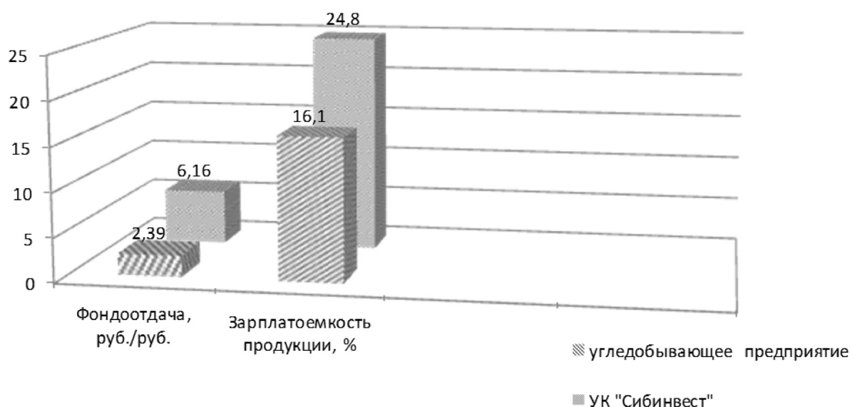
Рисунок 2. Сравнение показателей фондоотдачи и зарплатоемкости продукции объединения и индивидуально управляемого предприятия в 2015 г.

производства и новые ценности для потребителей (это производство продуктов питания, сельскохозяйственной продукции, фармацевтической и парамедицинской продукции, реализация высокотехнологичных услуг и т. п.) [Исупова, Костенко, Многопрофильные компании..., 2011].