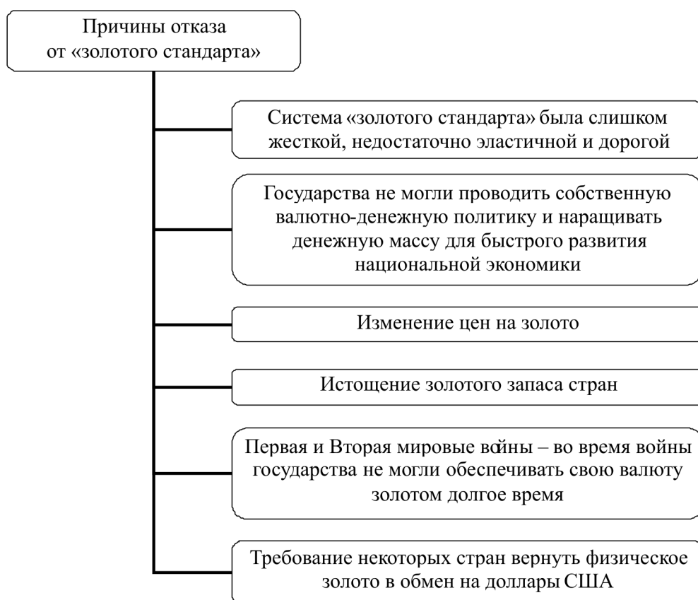
Рисунок 4. Основные монетарные причины отказа от «золотого стандарта»

По нашему мнению, следует выделить ряд монетарных причин, по которым золотой стандарт был отменен (рис. 4).