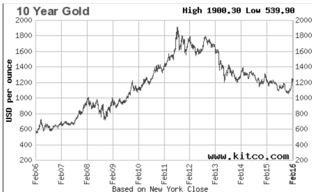
Рисунок 1. Динамика цен на золото с февраля 2006 года по февраль 2016 года, долл. США/унц.

Несмотря на колебание цен на золото на мировом рынке, стоимость его показывает уверенную динамику роста, значительно превосходящую многие прочие товары. Только за последние 10 лет (с февраля 2006 года по февраль 2016 года) по данным Нью-Йоркской биржи цена на унцию золота выросла более чем вдвое (рис. 1).