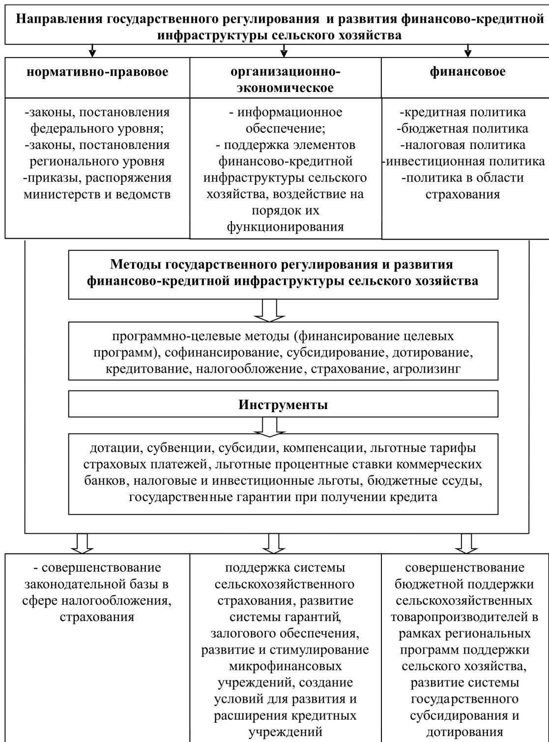
Рисунок 1. Государственное участие в регулировании и развитии финансово-кредитной инфраструктуры сельского хозяйства

вание и поддержка элементов финансово-кредитной инфраструктуры сельского хозяйства осуществляется через комплекс мер, указанных в соответствующих законодательных актах. А реализация этих законов осуществляется в зависимости от реальной ситуации в сельском хозяйстве.