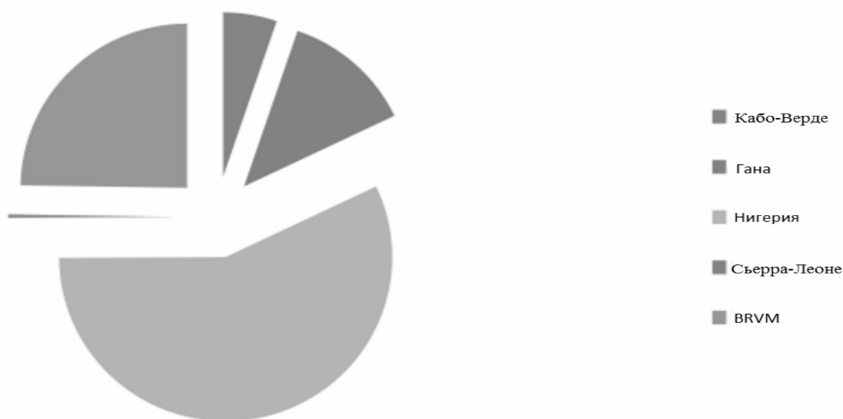
Рисунок 2: Рыночная капитализация фондовых бирж в ЭКОВАС 2015 (в млрд долл.) [African Bond Market, www]

Все страны сообщества, в том числе и Нигерия, являются в большей или меньшей мере экспортерами сырья и импортерами иностранных товаров из-за плохо развитого производственного сектора, т. е. их спектр товаров для продажи друг другу достаточно узок. Чек ЭКОВАС 2 не может применять вне мелкой или средней торговли и туризма. Если трансакции и происходят (напр., поставки нигерийской нефти), то они обеспечиваются посредством надежных международных кредитных инструментов.