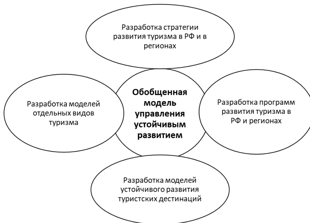
Рисунок 1 - Цели обобщенной модели управления устойчивым развитием (разработано автором)

Для создания эффективной модели управления всеми этими бизнес-процессами в динамике нами предложена обобщенная модель управления устойчивым развитием, основные цели которой отражены на рис. 1.