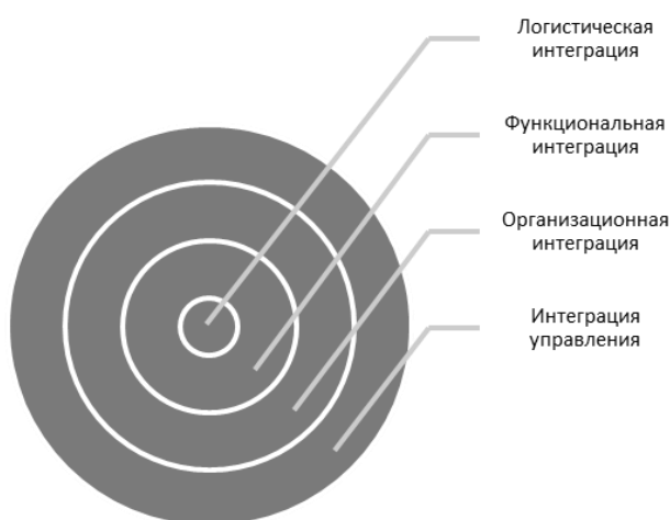
Рисунок 2 - Взаимообусловленность базисных форм логистической интеграции

Организационная интеграция и интеграция управления всей деятельностью могут характеризоваться различным сочетанием форм в каждом конкретном случае.