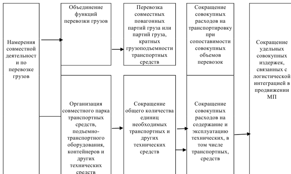
Рисунок 3 - Оптимизация перевозки грузов в результате интеграции транспортных подразделений предприятий

При заинтересованности в совместной работе в каждом конкретном случае с учетом самых разнообразных обстоятельств и конкретных условий функционирования объединяемых предприятий выбирается наилучший, устраивающий все стороны, оптимальный вариант организации процессов управления материальными потоками с позиций количества и размещения мест хранения при оптимальном объеме закупок, минимизации общей суммы арендной платы, рационального способа транспортировки. Логистическая интеграция способствует не только сокращению удельных совокупных издержек, но также позволяет субъектам интегрированного объединения распространять свое позиционирование на рынке, что положительно влияет на конкурентоспособность всех звеньев логистической системы.