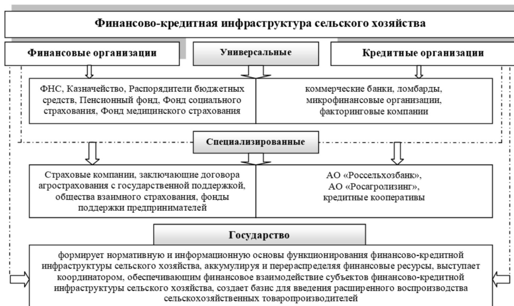
Рисунок 1. Институциональное строение финансово-кредитной инфраструктуры сельского хозяйства

Институциональное строение финансово-кредитной инфраструктуры сельского хозяйства представлено финансовыми и кредитными организациями, которые в свою очередь целесообразно разграничивать на универсальные и специализированные (рисунок 1).