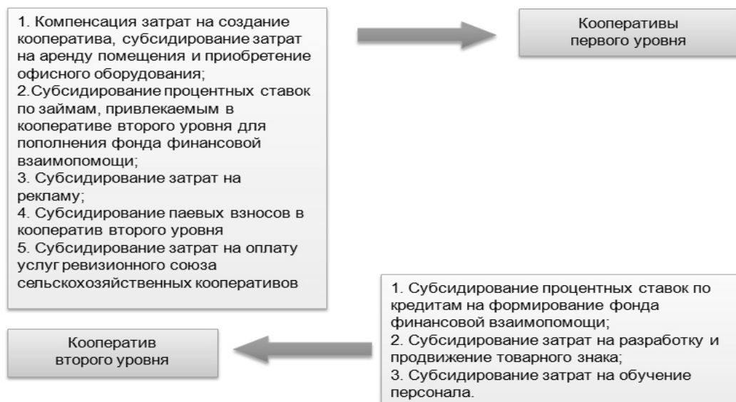
Рисунок 2 - Направления государственной поддержки сельскохозяйственных кредитных потребительских кооперативов

Рекомендуемые меры государственной поддержки в отношении сельскохозяйственных потребительских кооперативов, оказывающих услуги по проведению агротехнических работ, а также транспортные услуги включают в себя (рисунок 3).