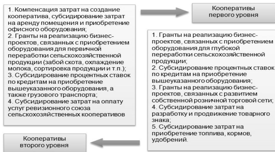
Рисунок 1 - Направления государственной поддержки сельскохозяйственных снабженческо-сбытовых перерабатывающих кооперативов

Анализ показал, что наиболее востребованным направлением является создание сельскохозяйственных снабженческо-сбытовых перерабатывающих потребительских кооперативов. С учетом предложенного разграничения функций между первым и вторым уровнем кооперативов необходимо осуществлять следующие меры поддержки (рисунок 1).