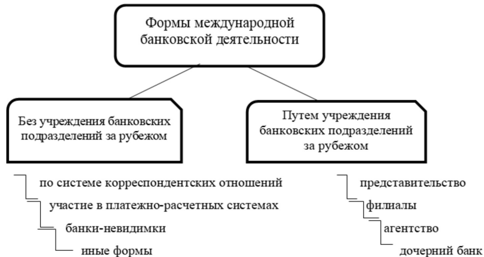
Рисунок 1. Организационно-правовые формы осуществления международной банковской деятельности транснациональных банков

Существование без учреждения банковских подразделений за рубежом имеет низкую степень вовлеченности банка в международный бизнес, т.е. не требуется открытие за рубежом институциональной единицы и для такой формы деятельности характерны корреспондентские отношения (взаимное открытие корреспондентских счетов, открытие корсчета только в одном банке или отношения без открытия корсчетов). Цель таких отношений – быстрое и надежное осуществление международных платежей своих клиентов, т.е. банк по просьбе банка-партнера может осуществлять операции для указанного лица на местном рынке [Никулина, Печенин, 144-150].