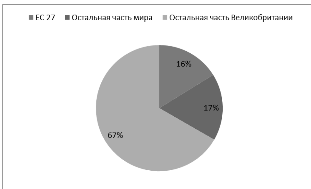
Рисунок 3 - Структура экспорта Шотландии [Gerry Hassan, Russell Gunson, 2017, 234]

Кроме того, как уже отмечалось ранее, шотландская экономика связана с ЕС в большей степени, чем любой другой британский регион: более 40% (или 11,5 млрд. фунтов) торгового оборота территории приходится на страны Европейского Союза (см рис. 3), поэтому и потери доступа к общему рынку для Шотландии будут очень болезненными.