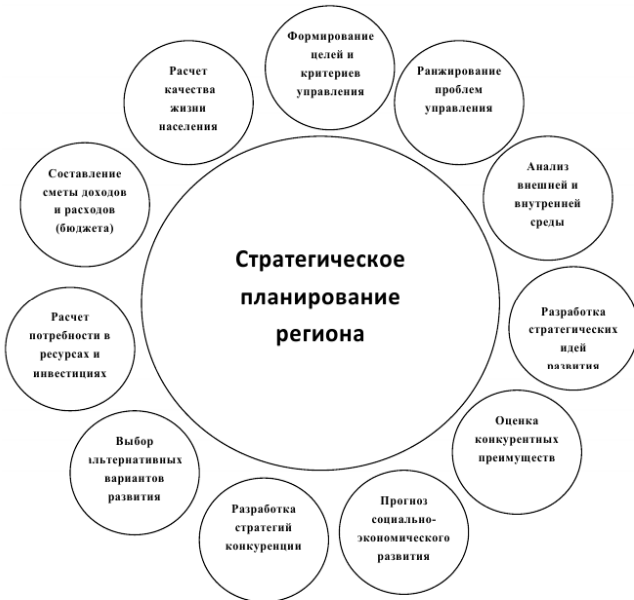
Рисунок 1 – Цикл стратегического планирования региона

Регион как объект стратегического управления с позиции системного подхода можно рассматривать как совокупность нескольких макроподсистем, взаимосвязанных между собой: