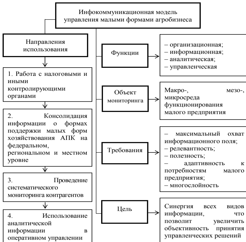
Рисунок 3 – Схема инфокоммуникационной модели управления малыми формами предпринимательской деятельности в АПК

На данном этапе возможно расширенное использование услуг третичного и четвертичного секторов экономической системы, при этом предприятие не меняет свои размеры и причисляется к малым формам, но основной задачей является повышение квалитетических характеристик продукции и культуры предпринимательства. Руководители данных предприятий являются не только хозяйственниками, но и высококвалифицированными управленцами, способными комбинировать модели управления бизнесом, используя прогностические подходы. С этой целью рекомендательной рецептурой является формирование инфокоммуникационной модели управления малыми предприятиями (рис. 3). Она направлена на максимизацию полезности информационного массива, необходимого для снижения предпринимательских рисков.