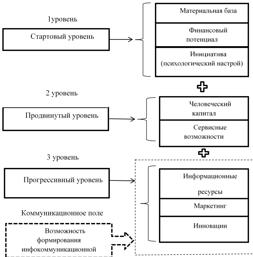
Рисунок 2 – Уровни трансформационных преобразований в зависимости от ментально-ресурсного потенциала сельскохозяйственного предприятия

группы малых предприятий представлен специалистами агропроизводственной деятельности (агрономия, зоотехния, ветеринария). Бизнесу продвинутого уровня присущи перманентность и стабильность, целевые установки ограничены уровнем собственного благосостояния и желанием придерживаться опробованных и низкорисковых методов ведения дела.