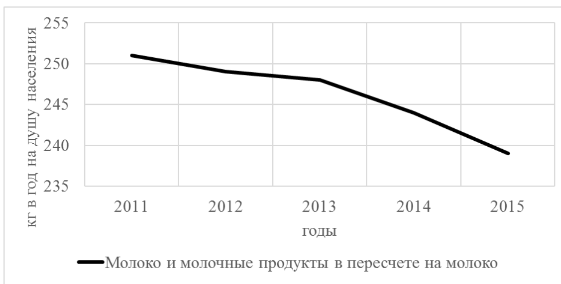
Рисунок 1 - Динамика потребления молока и молочных продуктов населением РФ

Несмотря на очевидную ценность молока, потребление этого продукта в нашей стране, хоть и незначительно, но снижается на протяжении всего периода анализа (рис. 1)