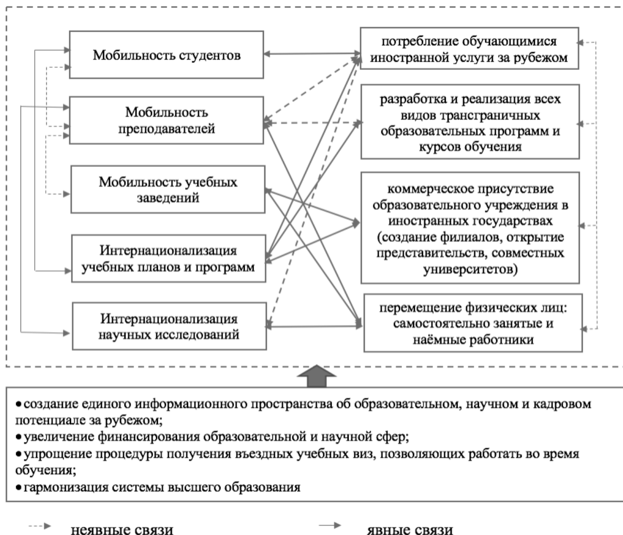
Рисунок 2 - Увеличение экспорта высшего образования через его интернационализацию

Схему экспорта услуг высшего образования можно представить через его интернационализацию (рис. 2).