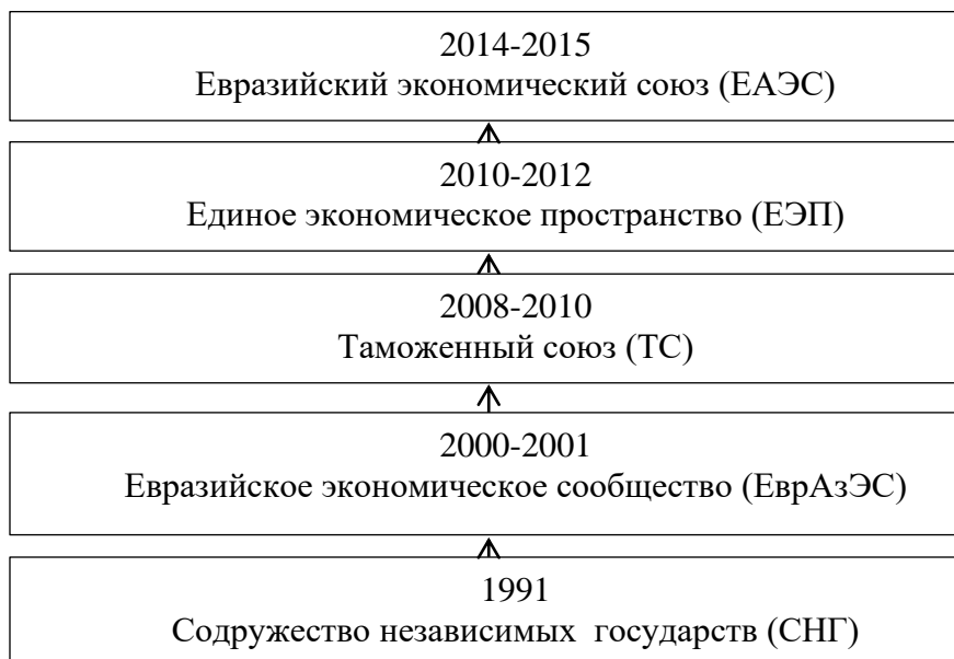
Рисунок 1 – Часовые границы и организационно-экономические формы развития экономической интеграции стран-участниц ЕАЭС

Воздействуя на экономику через таможенно-тарифное регулирование, странами-участницами ЕАЭС осуществляется решение задач, которые можно увидеть на рис. 2 [Kirkham, 2016, 112].