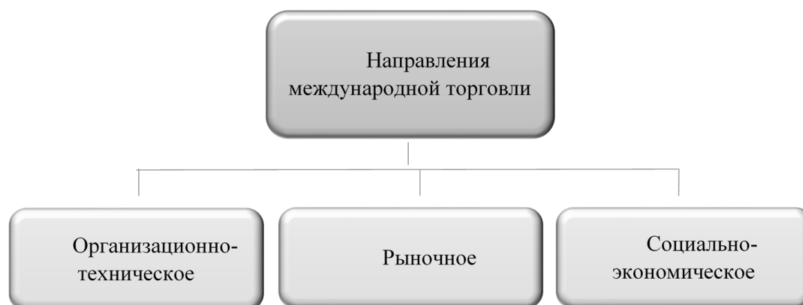
Рисунок 1 - Направления международной торговли

2. Рыночное направление определяет, что международная торговля выступает в виде совокупности спроса и предложения, где спрос – это общее количество товаров, которые потребители готовы по настоящим ценам купить, а предложение – это объем товаров, который при действующих ценах производители способны предложить. В импорте и экспорте происходит материализация спроса и предложения.