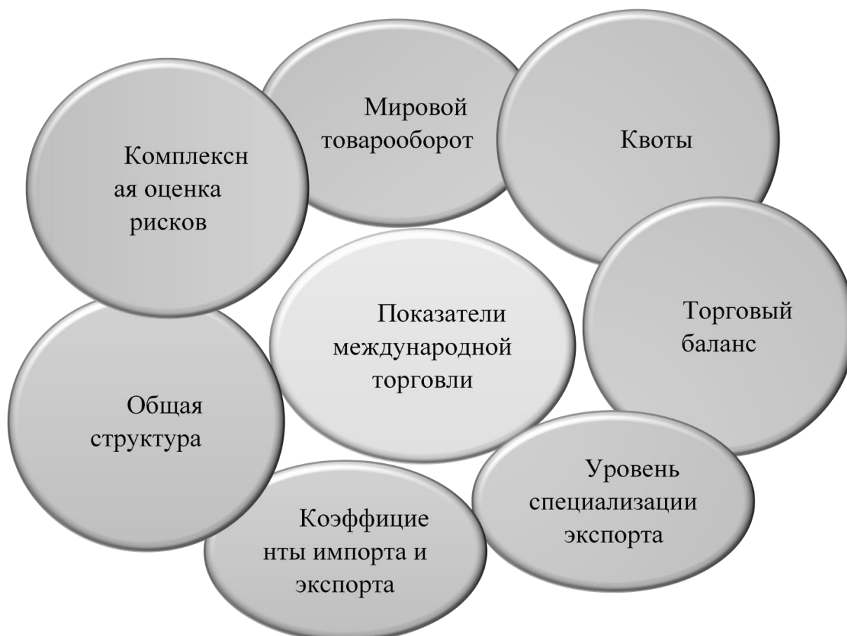
Рисунок 2 - Показатели международной торговли

Выделяют также семь основных показателей, характеризующих международную торговлю (рис. 2):