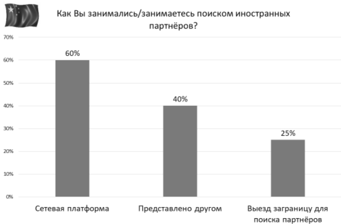
Рисунок 2 – Ответы китайских предпринимателей на вопросы анкеты