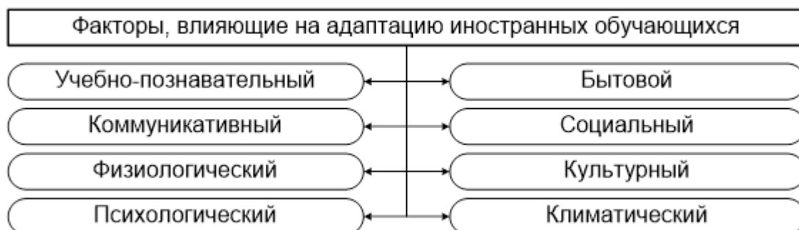
Рисунок 1 – Факторы, влияющие на адаптацию иностранных обучающихся

Разные авторы говорят об одних и тех же факторах адаптации, используя разную терминологию и основания для объединения факторов в более крупные группы. На рисунке 1 представлены факторы, влияющие на адаптационный процесс иностранных обучающихся в российских вузах с точки зрения различных авторов.