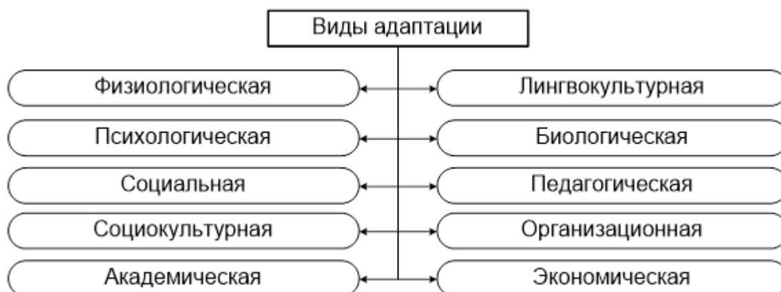
Рисунок 2 – Виды адаптации иностранных обучающихся

В силу того, что различные обстоятельства и факторы процесса адаптации, которые были рассмотрены выше, по-разному влияют на иностранных студентов, результаты профессиональной адаптации у них будут различными, это позволяет выделить основные виды адаптации иностранных обучающихся в вузе (рис. 2).