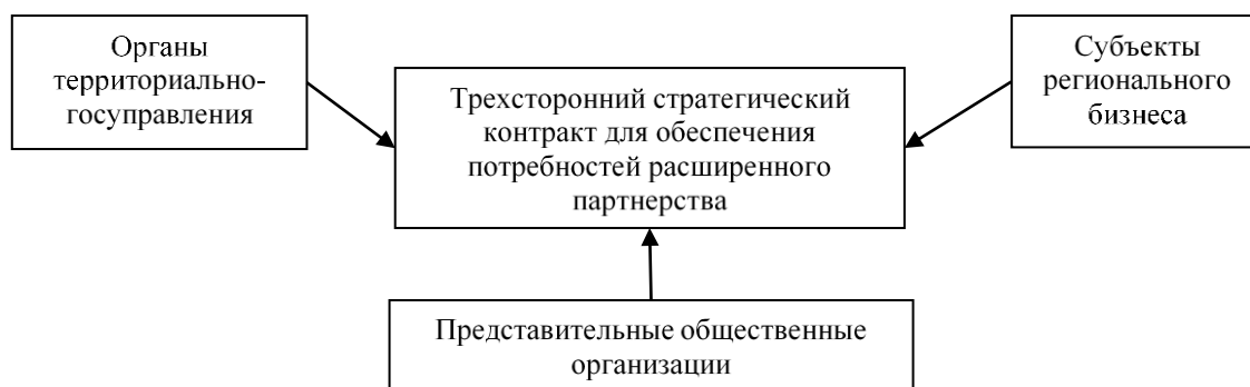
Рисунок 3 – Схематическое представление трехстороннего стратегического контракта для обеспечения потребностей расширенного партнерства

способ разрешения спорных ситуаций между сторонами.