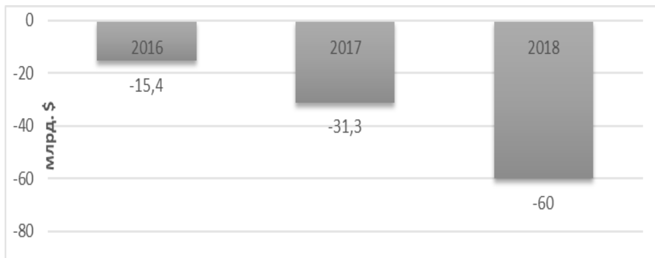
Рисунок 2. Зависимость ВВП России от цены на нефть