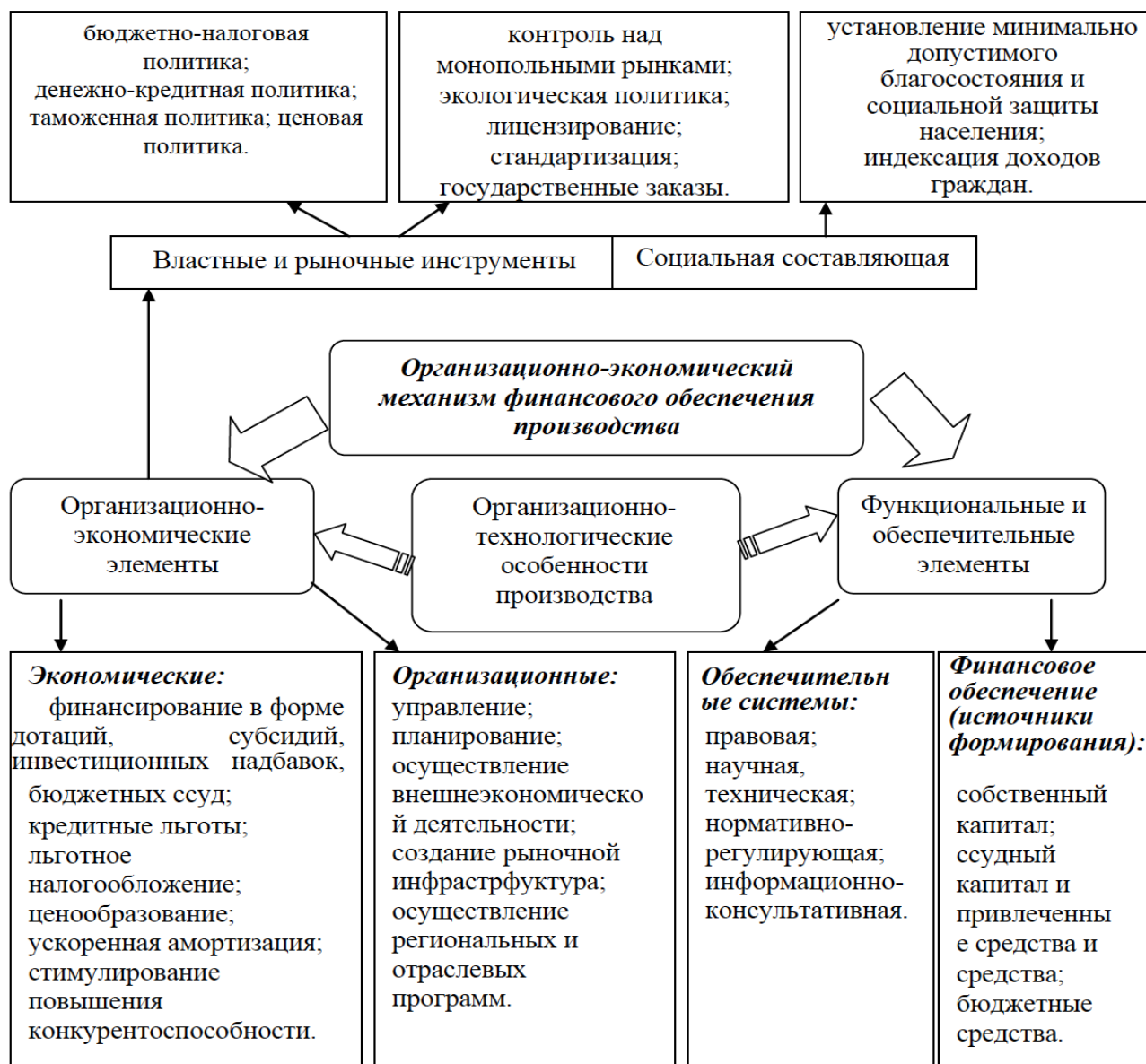
Рисунок 3 - Структура организационно-экономического механизма финансового обеспечения аграрного производства

общеэкономические (накопленная стоимость, объект права собственности, объект влияния фактора времени, фактор экономического и социального развития), финансовые (объект финансового управления, источник дохода, источник риска, источник погашения финансовых обязательств) и индивидуальные (активы с высокой трансформационной способностью, основной компонент финансового потенциала) (рис. 4.).