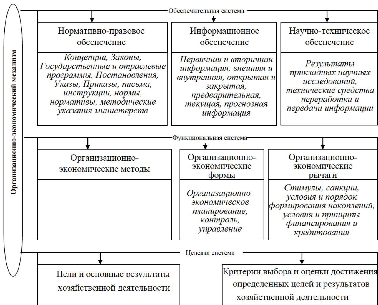
Рисунок 2 - Структура организационно-экономического механизма хозяйственной деятельности

через организационные и экономические рычаги, что способствует формированию и усилению экономического потенциала и эффективности хозяйственной деятельности в целом [Базилян, Чунихин, 2016, 229].