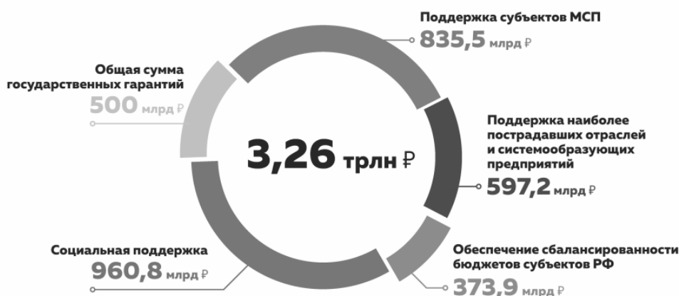
Рисунок 1 - Структура финансирования антикризисных мер, направленных на борьбу с последствиями пандемии коронавируса в Российской Федерации, 2020 г. [О поддержке..., www]