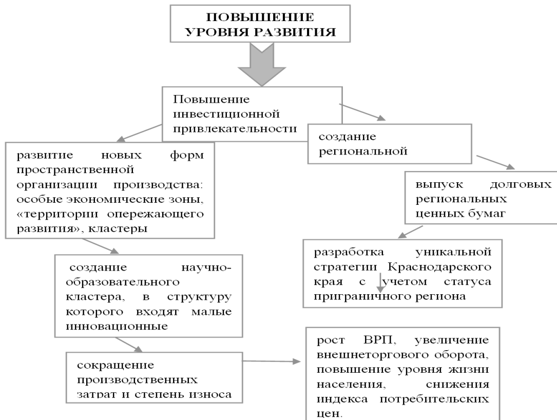
Рисунок 5 – Пути повышения темпов развития хозяйственного комплекса Краснодарского края