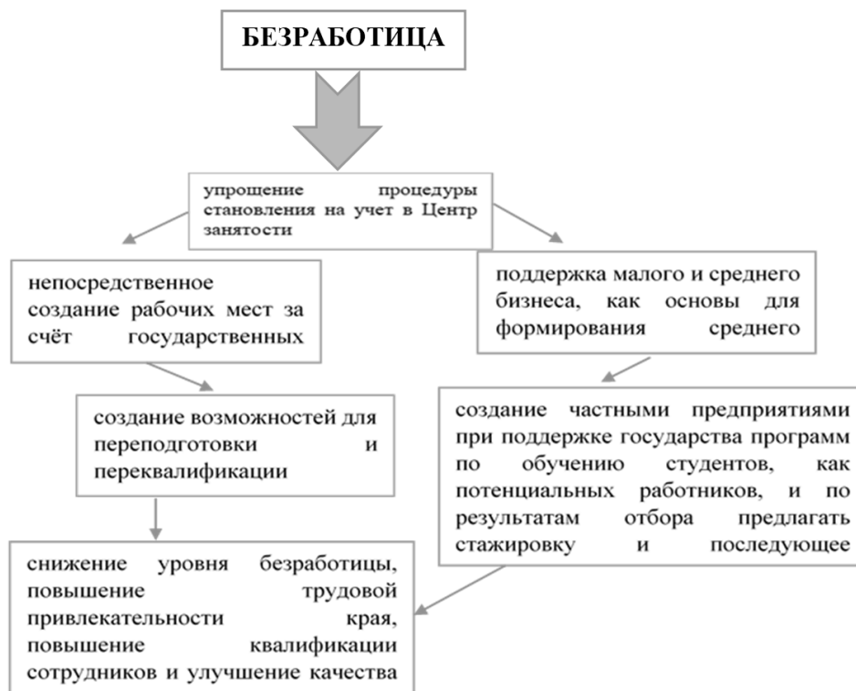
Рисунок 3 – Пути снижения уровня безработицы в Краснодарском крае