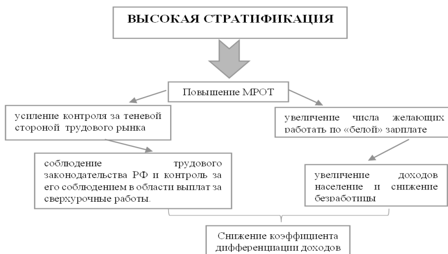
Рисунок 2 – Пути решения проблемы высокой стратификации населения по уровню доходов в Краснодарском крае

На основе проведенного исследования целесообразно выдвинуть следующие рекомендации для улучшения сложившейся ситуации следует предложить способы снижения угроз и увеличения уровня экономической безопасности Краснодарского края в виде алгоритмов для каждой из выявленных проблем (рис. 2–6).