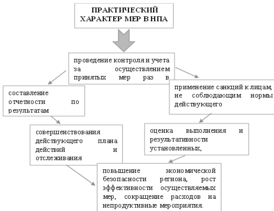
Рисунок 4 – Пути усиления практического характера мер, прописанных в НПА