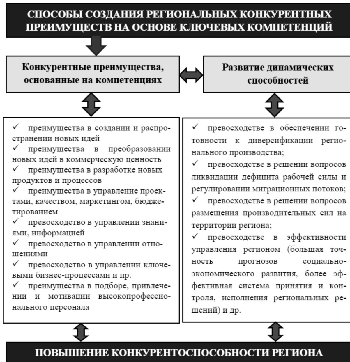
Рисунок 2. Роль региональных ключевых компетенций в повышении территориальной конкурентоспособности [Туменова, 2019]

Отталкиваясь от представленных на вышеприведенном рисунке позиций, по нашему мнению, одним из наиболее перспективных направлений формирования региональных ключевых компетенций как формы воплощения уникального человеческого капитала, которым обладает конкретная территория, является задействование такого его элемента как креативный капитал. При этом еще до введения в научный оборот данного понятия А. Андерссон отнес креативность к числу важнейших факторов регионального развития [Andersson, 1985].