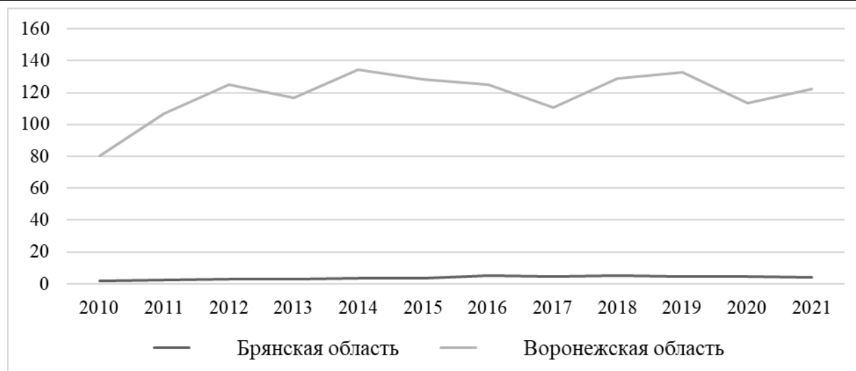
Рисунок 5 – Динамика объёма посевных площадей ячменя в Брянской и Воронежской областях

Обращаясь к данным рисунка 5, можно сделать вывод, что выращивание ячменя особенно развито в Воронежской области, поскольку на протяжении всего исследуемого периода объёмы посевных площадей этой культуры имеет достаточно высокие показатели. В Брянской же области выращивание ячменя практически не развито: стабильно низкие объёмы посева на протяжении всего периода.