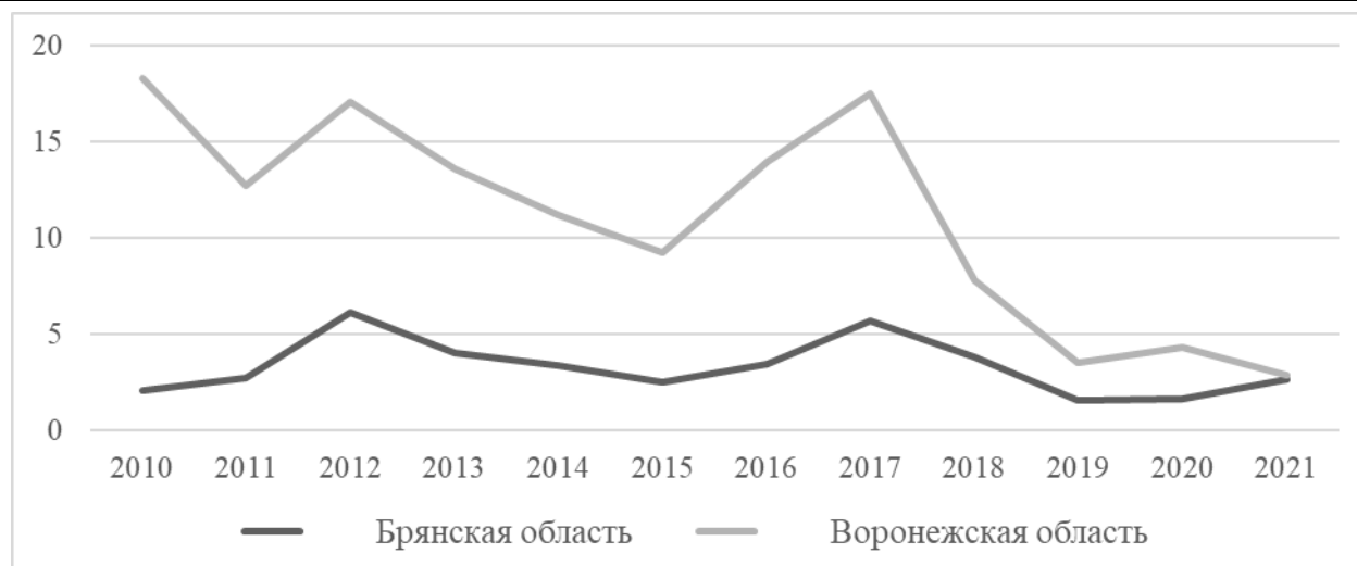
Рисунок 1 – Динамика объёма посевных площадей гречихи в Брянской и Воронежской областях

Обращаясь к данным рисунка 1, можно заметить, что объёмы посева гречихи на протяжении всего исследуемого периода имеют отрицательную динамику, и, более того, относительно других исследуемых культур имеют незначительные посевные площади в абсолютном выражении.