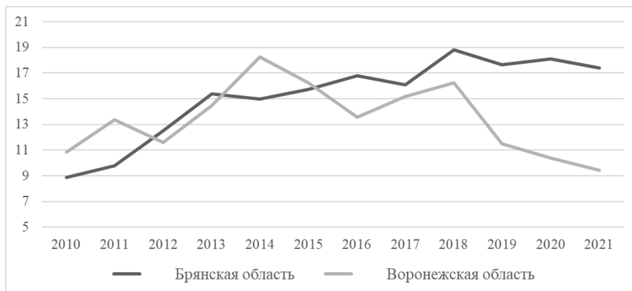
Рисунок 2 – Динамика объёма посевных площадей овса в Брянской и Воронежской областях

Также стоит сказать, что гречиха не является биржевым товаром, и, в целом, основная часть спроса на данную культуру присутствует на территории Российской Федерации.