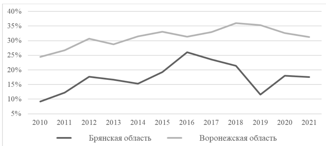
Рисунок 31 – Доля посевных площадей, засеянных ячменем, обрабатываемая крестьянскими фермерскими хозяйствами в общем числе площадей, засеянных ячменем

Обращаясь к данным, представленным на рисунке 3, можно говорить о росте долей посевных площадей, обрабатываемых крестьянскими фермерскими хозяйствами на протяжении всего периода анализа и в Брянской, и в Воронежской областях. Так, в Воронежской области доля посевных площадей, засеянных ячменем, вплоть до 2021 года, хотя и имеет некоторую волнообразность, неуклонно возрастает (с 24% в 2010 г. до 31% в 2021 г.). Динамика доли посевных площадей, засеянных ячменем, и обрабатываемых крестьянскими фермерскими хозяйствами в Брянской области имеет гораздо более выраженную волнообразность, тем не менее, за весь исследуемый период также увеличивается (с 9% в 2010 г. до 18% в 2021 г.).