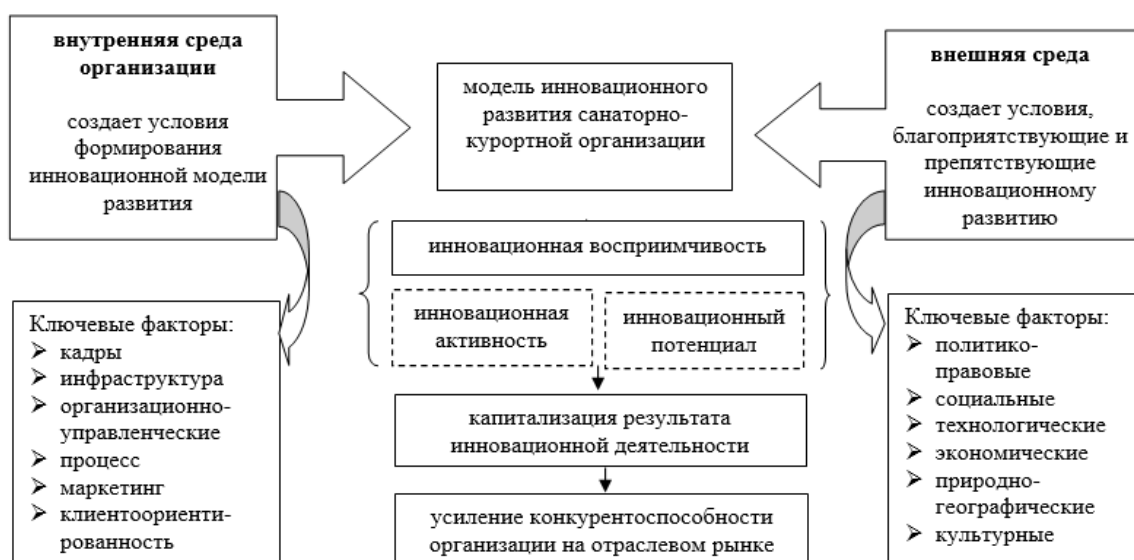
Рисунок 1 - Модель инновационного развития санаторно-курортной организации как основа ее конкурентоспособности. Составлено автором на основе работ И. Парамоновой и М. Войтешонок

инструментов распределены по следующим уровням: микроуровню, мезоуровню и макроуровню.