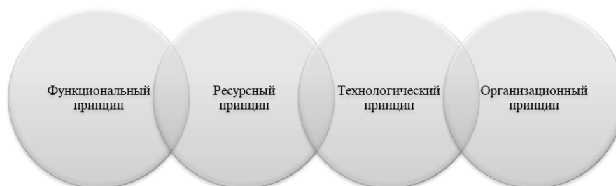
Рисунок 4 - Основные принципы объединения элементов социально-экономической системы

Усовершенствование социально-экономической системы зависит от степени воздействия со стороны экономических субъектов (государства, бизнеса, институтов и т.д.). Существуют определенные принципы при помощи которых происходит объединение элементов подсистем в социально-экономическую систему (Рисунок 4).