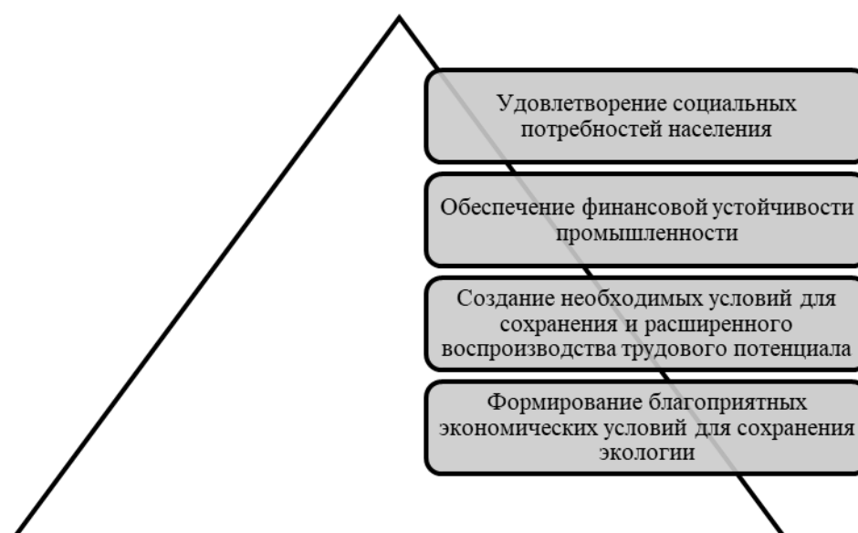
Рисунок 5 - Ключевые направления развития СЭС

На современном этапе главной целью социально-экономической системы выступает обеспечение региона всеми необходимыми ресурсами для комфортного уровня жизни населения, общего развития промышленности и повышения его конкурентоспособности. Именно от того, насколько будет эффективна СЭС будет зависеть будущая результативность экономики в целом.