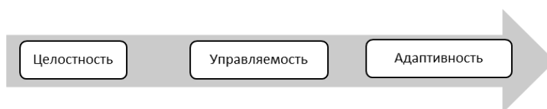
Рисунок 2 - Ключевые свойства современной СЭС

В свою очередь свойство целостности актуализирует важность каждого элемента социально-экономической системы, свойство управляемости подразумевает в себе наличие в социально-экономических элементах обратной связи, для своевременного устранения возникающих в процессе управления проблем и в заключении, свойство адаптивности означает мобильность социально-экономической системы к нестабильным условиям ее существования.