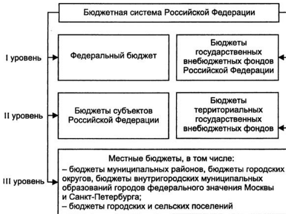
Рисунок 1 - Место бюджета муниципального образования в бюджетной системе РФ

Бюджетный процесс на региональном и местном уровнях бюджетной системы РФ, несмотря на то что регулируется правовыми актами субъектов РФ и органов местного самоуправления, базируется на общегосударственных нормах бюджетного законодательства.