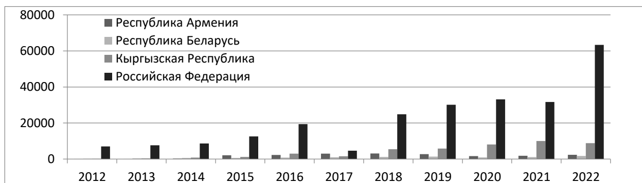
Рисунок 1 - Сведения о численности граждан государств – членов ЕАЭС, въехавших в РФ для осуществления трудовой деятельности, за 2012–2022 гг., человек