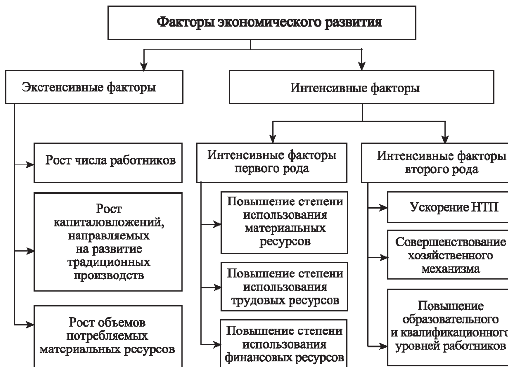
Рисунок 2 - Влияние экстенсивных и интенсивных факторов на государственную макроэкономическую политику