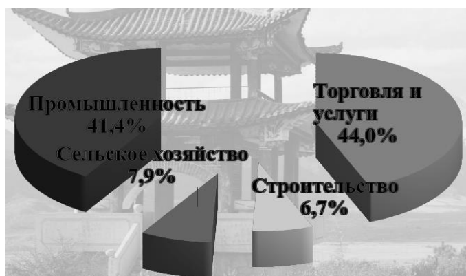
Рисунок 2 - Структура ВВП Китая (в % от общего показателя ВВП)

Таким образом, большую долю в структуре ВВП России занимает торговля 57,9%, на втором месте находится промышленность 30,5%, строительная отрасль занимает 7,4%, сельское хозяйство – 4,2%. Для сравнения рассмотрим структуру ВВП Китая (рис. 2).