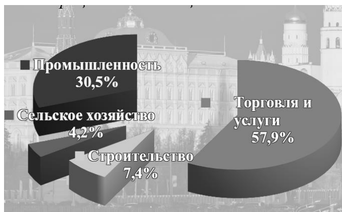
Рисунок 1 - Структура ВВП России

Россия и Китай занимают лидирующие позиции на рынке в различных секторах экономики. Рассмотрим структуру ВВП России в процентах от общего показателя ВВП (рис. 1).